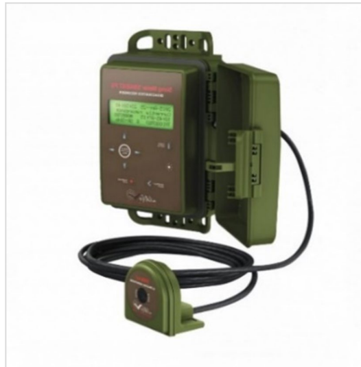
Fotografía 1. Grabadora fija "Song Meter SM4BAT FS"

Con los resultados obtenidos se ha efectuado un estudio de la riqueza de quirópteros presentes en esa zona, así como de la presencia de especies detectadas a distintas alturas para estudiar la tasa de riesgo de colisión. Sin embargo, cabe destacar que no es posible hacer un estudio de abundancia, debido a que estos aparatos detectan llamadas ( Calls ) y no individuos.