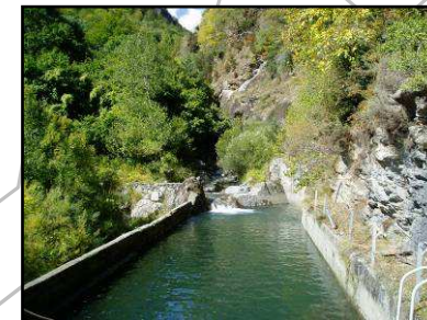
Azud de Molerró