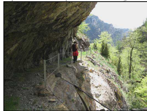
Senda La Creu

puntos y en el riesgo de desprendimiento de piedras en días de lluvia, ya que atraviesa una estrecha faja en una impresionante pared rocosa. Una vez que llegamos a la cámara de carga es importante no salirse del camino marcado y estar atentos a la señalización. Continuando por el canal el sendero nos conducirá de regreso a la parte baja del pueblo de Aneto.