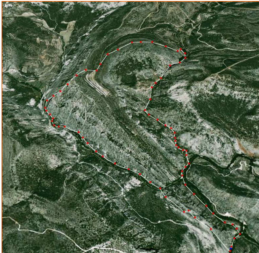
Ortoimagen del área propuesta como Monumento Natural

Señalar en primer lugar que se trata de una zona en la que se integra el paisaje dominante de las calizas verticales con los valles encajados de los ríos Guadalope y Pitarque, con sus pequeños sectores de zonas cultivadas en fajas. El espectacular paisaje es la suma de estos elementos, roca y agua, la verticalidad de los estratos y las riberas con sotos lineales y con un río de curso rápido y aguas limpias, con su fauna y flora asociadas. En consecuencia, es difícil interpretar este paisaje y justificar los límites propuestos si no se integran las riberas señaladas dentro de los límites del espacio, máxime cuando las mismas ya son Dominio Público Hidráulico.