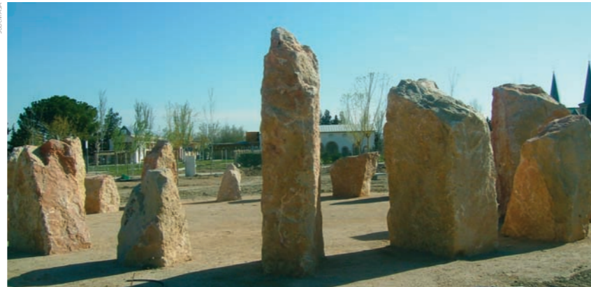
Jardín de Rocas La Alfranca.