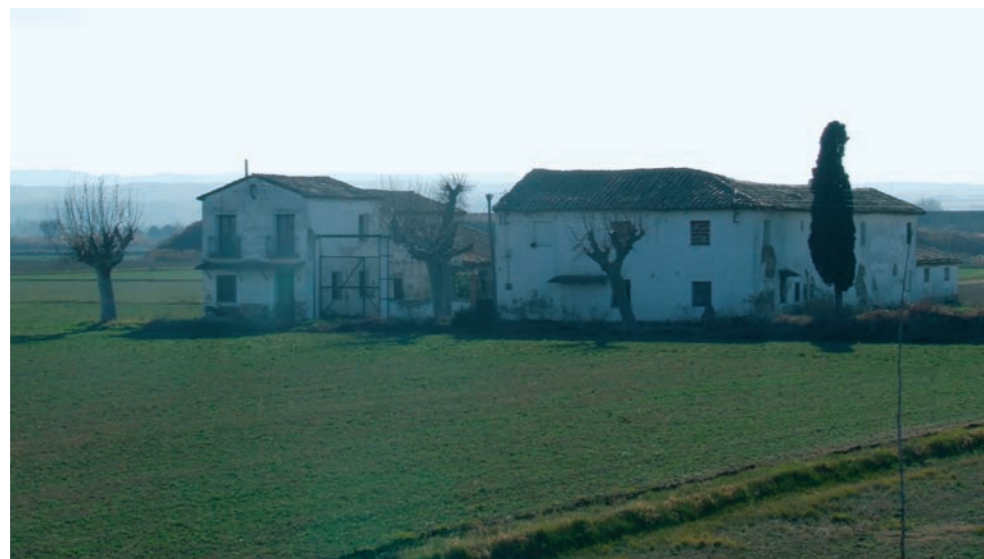
Torre del Pilar.