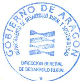
Jesús Nogués Navarro

EL DIRECTOR GENERAL DE DESARROLLO RURAL,