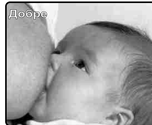
Малюнок на листівці "МатеринськеГодування" від Ради Здоров'я Андалусії