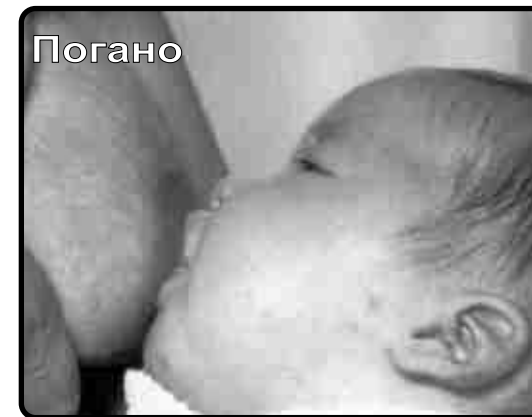
Дитина захвачує тільки сосок

Листівка виготовлена при сприянні Via Lactea до святкування Міжнародного Тижня Материнського Годування 2003-ього рокую. Таким чином хочемо побажати щасливого перебуття в Арагоні, матерям, що прибувають сюди з інших країн.