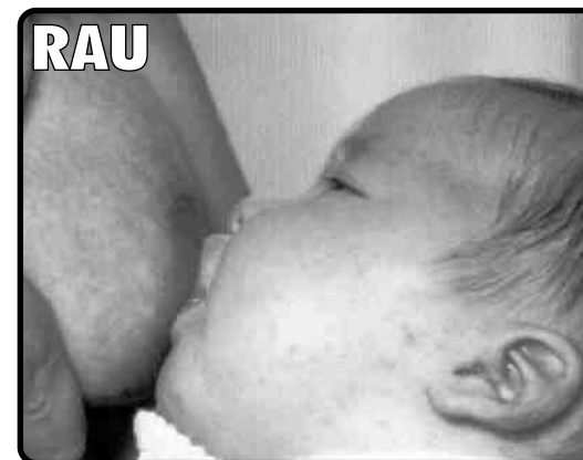
Pruncul ia doar sfîrcul.

Broșură elaborată prin Vía Láctea pentru celebrarea Săptămânii Mondiale pentru Laptăția Maternă din anul 2003. Dorim ca prin această formă să vă dăm cel mai călduros bun venit la toate mamele ce sosesc în Aragon din alte țări.