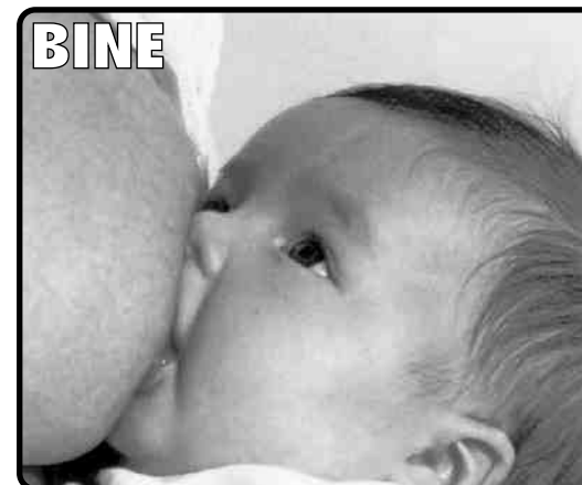
Imagini din broșura de Laptatie Maternă ale Consiliului de Sănătate de Andalucia.

Pruncul apucă în gură sfîrcul și o parte din aureolă.