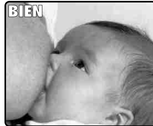
(Image de la brochure de la Consejería de Salud d'Andalousie sur l'allaitement maternel)

Le bébé embrasse avec sa bouche le mamelon et une bonne partie de l'aréole.