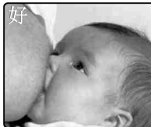
Lactancia Materna de la Consejería de Salud Andalucía 的小册子的介绍