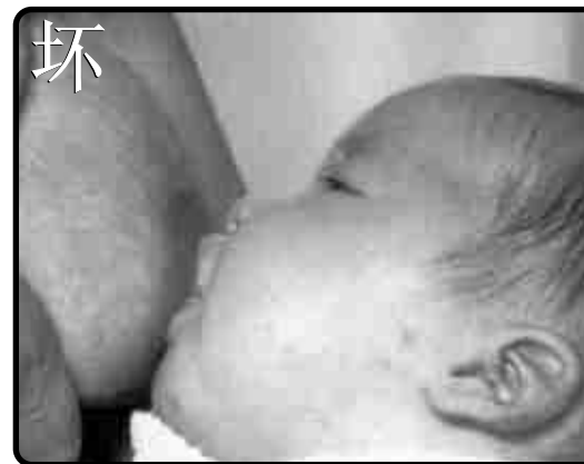
小宝宝只会拿奶头。

VIA LACTEA为庆祝2003年的世界母乳星期而做的小册子，与此同时我们也欢迎来自各地的母亲。