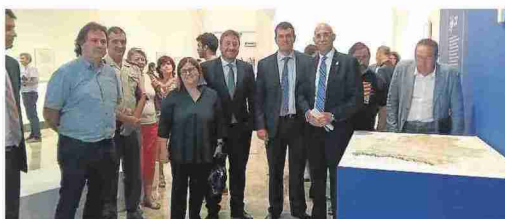
Un momento de la inauguración de la exposición el pasado 5 de septiembre.