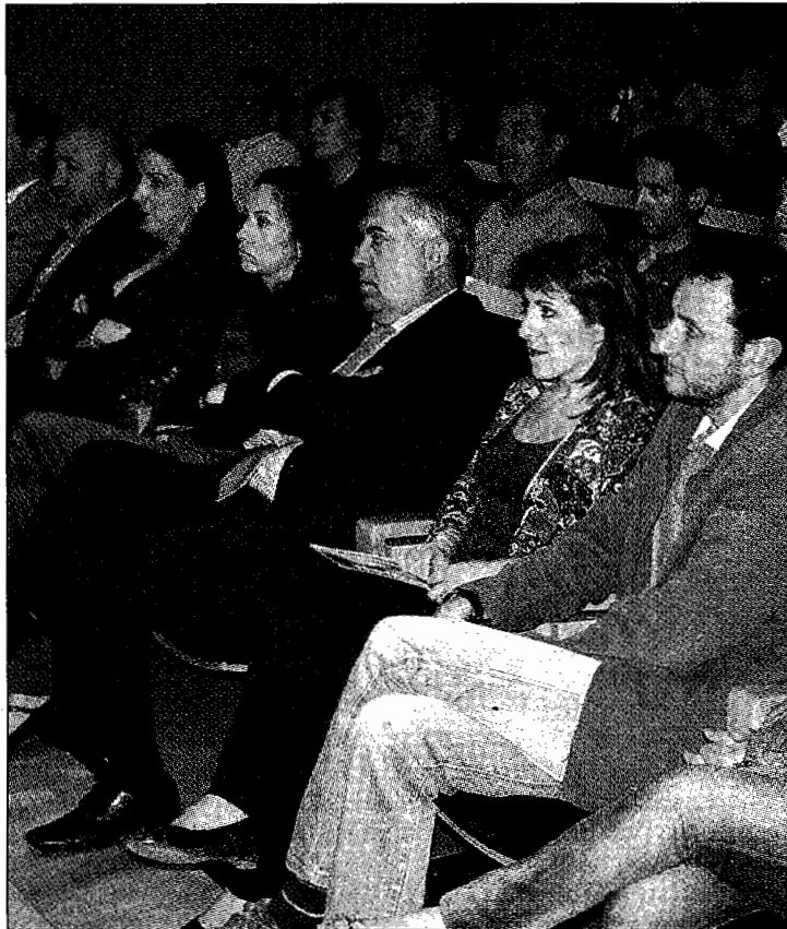
Representantes de las distintas administraciones, ayer en Alcañiz

Los fondos son aportados principalmente por el Gobierno de España y el Gobierno de Aragón, con una aportación de cada comarca.