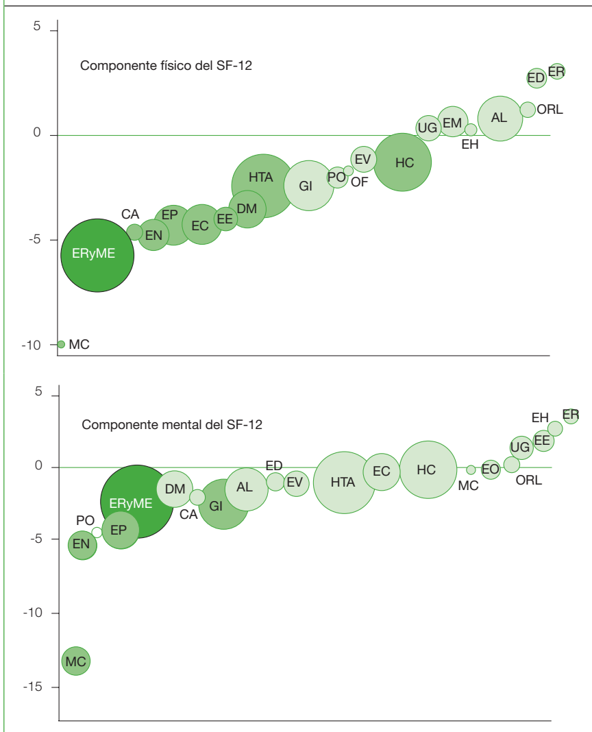
Gráfica 2. Calidad de vida en enfermedades crónicas.

Los paneles muestran la puntuación media en el cuestionario de calidad de vida SF-12 (superior en el componente físico e inferior en el mental) de distintas enfermedades o grupos de enfermedades. El tamaño del círculo se corresponde con la prevalencia del problema.