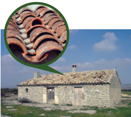
>> Edificio restaurado