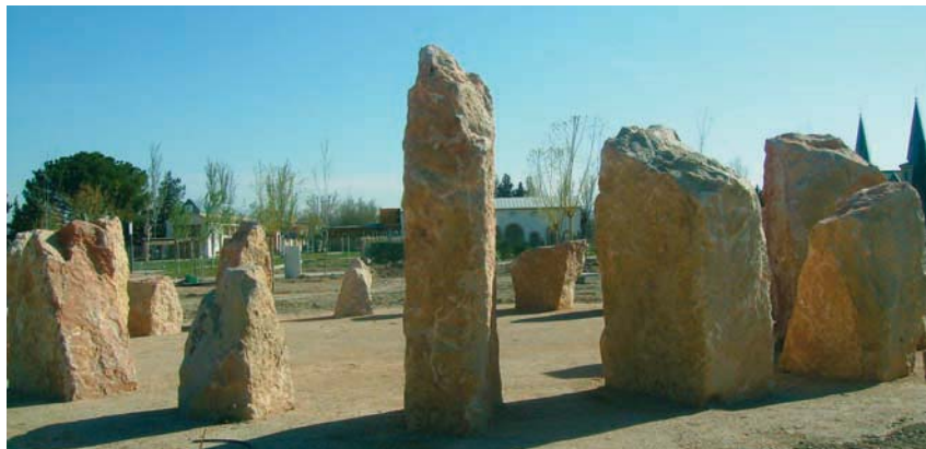
Jardín de Rocas La Alfranca.