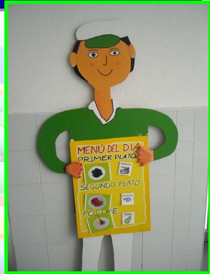
Cartel anticipador del menú diario en Sistema Pictográfico de Comunicación y foto real

Contenidos trabajados relacionados con la salud, la alimentación, el cuidado del cuerpo y la sexualidad, la higiene personal, y las habilidades sociales y para la vida, que se abordan en el Proyecto Curricular, y se trabajan de manera sistemática y continua, con la implicación de todos los profesionales del centro.