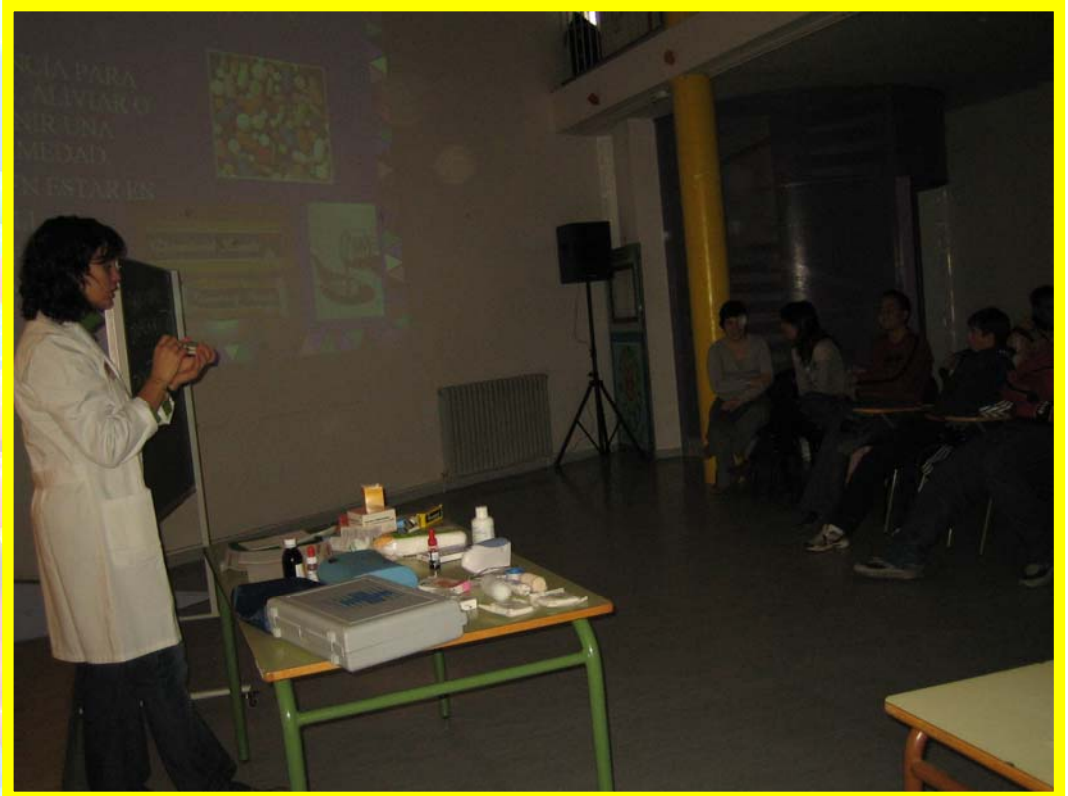
La enfermera del centro en una sesión de trabajo sobre Primeros Auxilios con alumnado de la Etapa Secundaria.

④ Incrementar nuestra formación en temas relacionados con la educación para la salud.