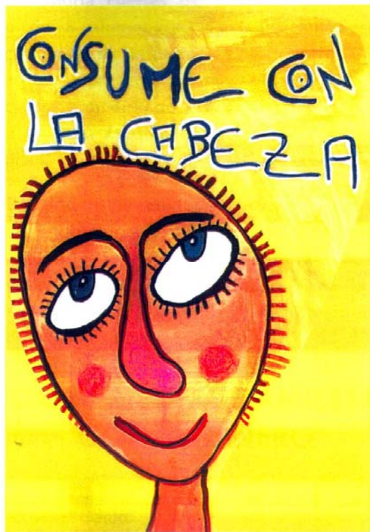
Colegio Público de E. E. "Gloria Fuertes" ANDORRA (Teruel)