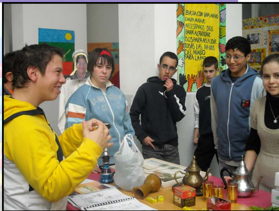
Actividad de convivencia y conocimiento de la cultura marroquí en el marco del Día de la Paz