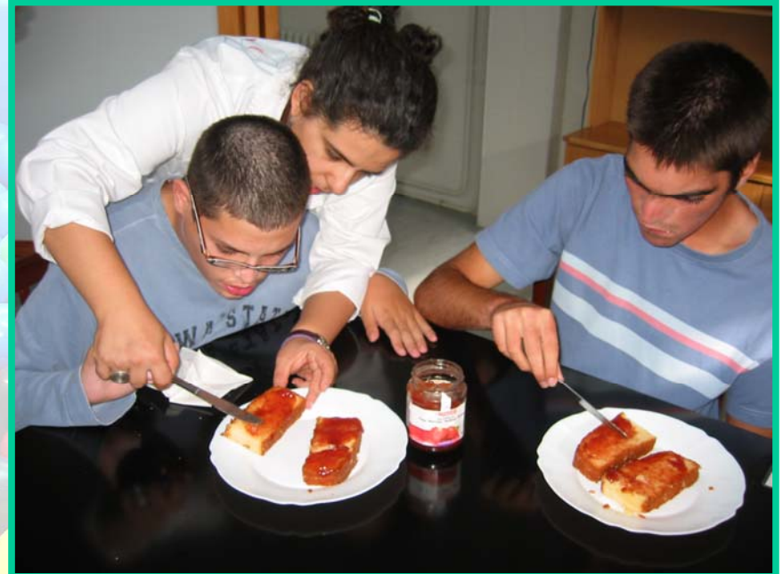
Tutora con dos alumnos en una actividad de autonomía personal en el taller de habilidades domésticas.