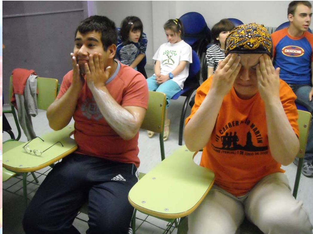
Alumnos/as de Etapa Secundaria aprendiendo a extenderse la crema solar.