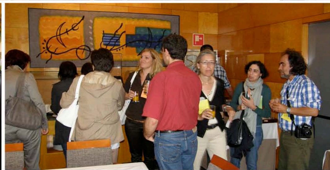
Un pequeño descanso con café de Comercio Justo para afrontar la parte más estimulante de la tarde. El taller participativo y de trabajo en grupo