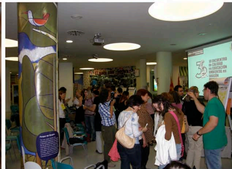
No nos podíamos ir sin evaluar. Y nuestro método es la evaluación participativa. Muchas gracias a todos por el trabajo y el entusiasmo aportado. Nos vemos en el IV Encuentro de Calidad en Educación Ambiental en Aragón.