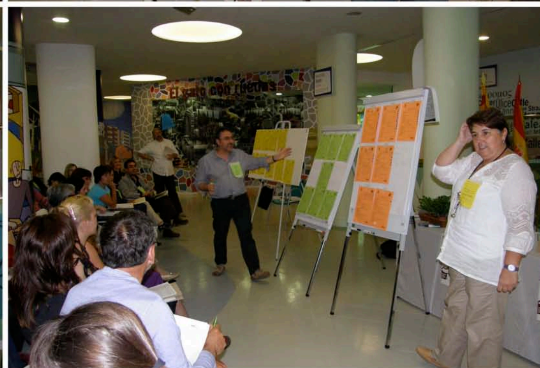
Tras ese trabajo, nos juntamos ya en gran grupo. Se expuso, por parte de los dinamizadores-facilitadores del taller, los 3 proyectos elegidos en cada grupo. Luego se eligió un décimo de entre los cuartos de cada subgrupo. Ya teníamos 10 proyectos a los que realizar el acompañamiento para validar los criterios de calidad.