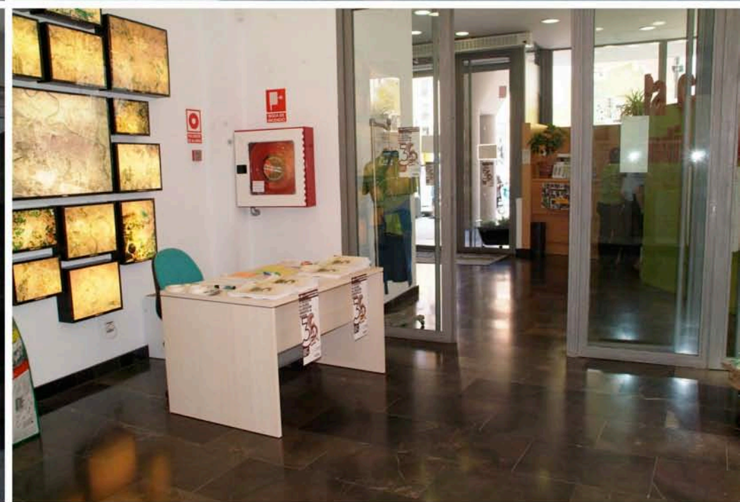
El 15 de junio de 2010 tuvo lugar el III Encuentro de Calidad en Educación Ambiental en Aragón, celebrado en La Calle Indiscreta - Aula de Medio Ambiente de Zaragoza, un innovador equipamiento de educación ambiental sobre los entornos urbanos del Departamento de Medio Ambiente del Gobierno de Aragón.