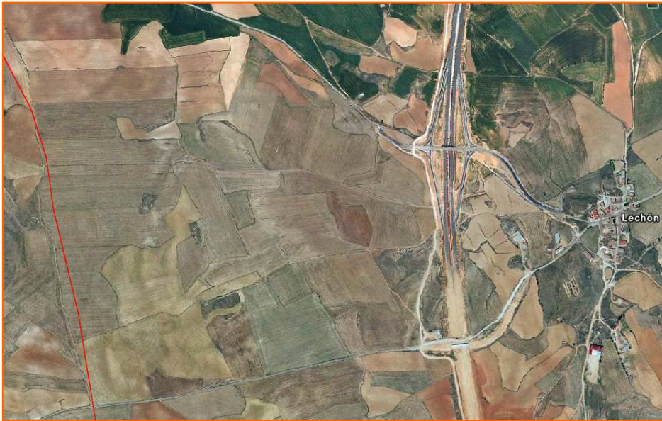
Ortoimagen de la zona de planeamiento.

Respecto al tipo de terrenos seleccionados para la ejecución del PGOU de Lechón, cabe señalar que corresponden -tal y como se justifica en el documento y planos remitidos a este Consejo- a campos de cultivo de secano tradicional, situados en las inmediaciones del núcleo urbano, constituyendo zonas de reducido valor natural, bastante degradadas, y de escaso valor agronómico y paisajístico.