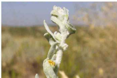
>> Al-arba en flor