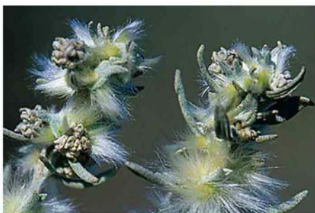
>> Al-arba con frutos