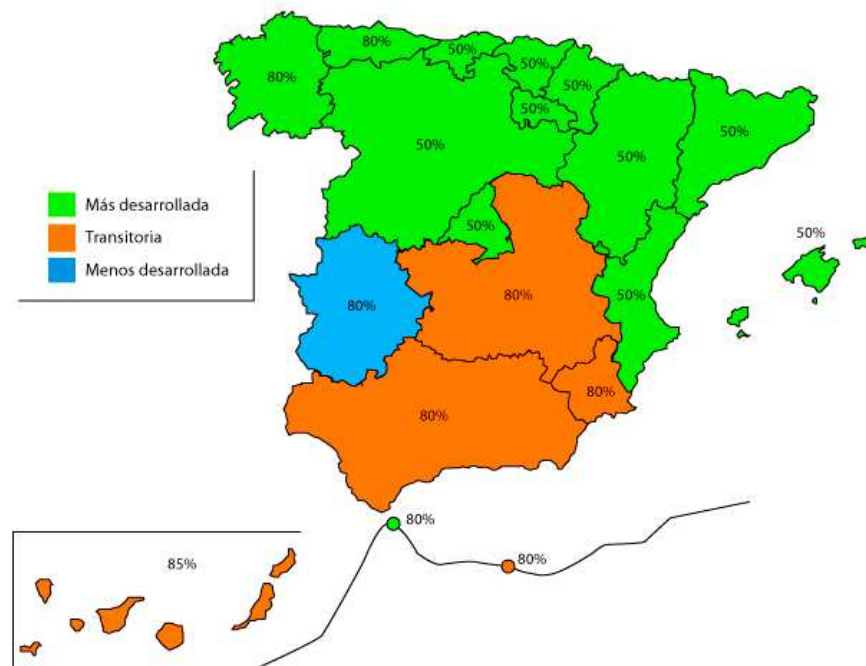
Tasas de cofinanciación del FSE en España

En Aragón la tasa de cofinanciación es el 50% (mas desarrollada).