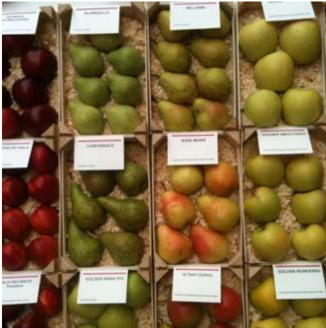
Exposición de variedades de manzanas y peras del stand de @irtacat en la Fira Sant Miquel de Lleida 2015 https://www.instagram.com/p/8GFo9JrsYh/

(Informació actualitzada amb el BOE núm 297 de 12/12/2015)