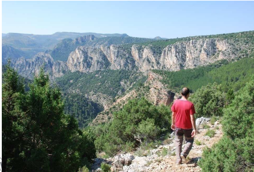
Barranco de Cueva Muñoz