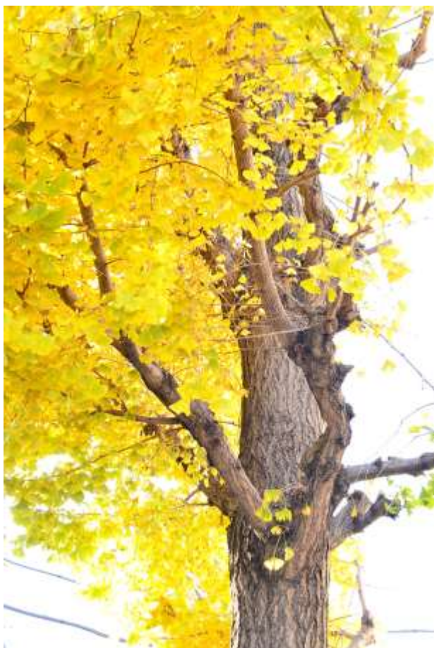
:go biloba