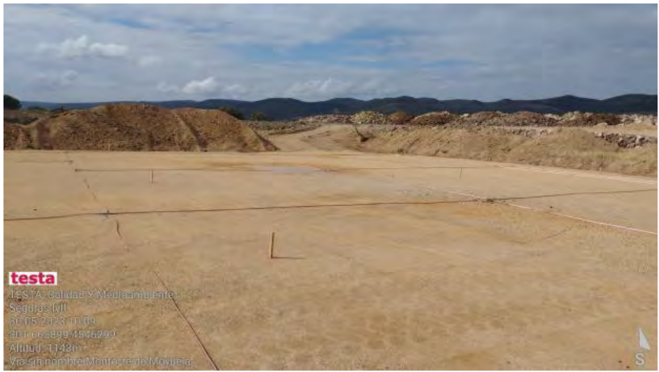
Avances en SET