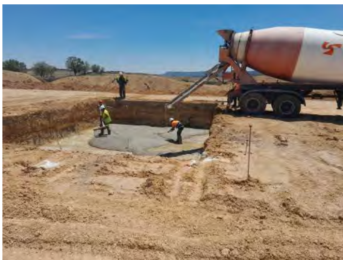
Hormigonado de limpieza en SET Seguras