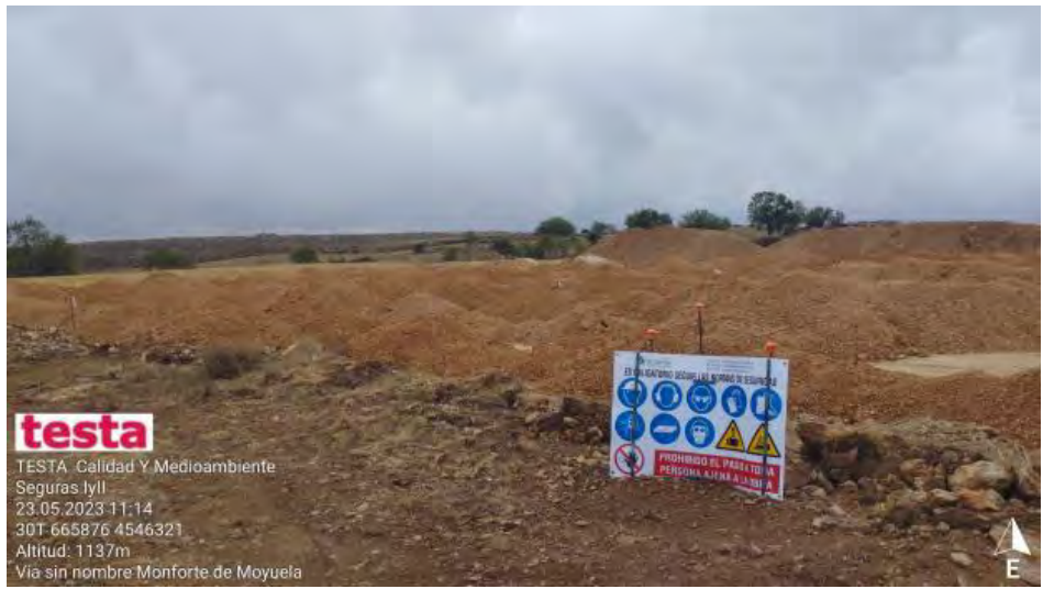
Acopio de zahorra en SET