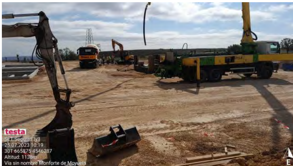
Hormigonado durante la visita en SET Seguras.