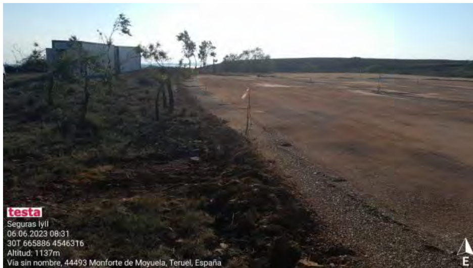
Avances en SET