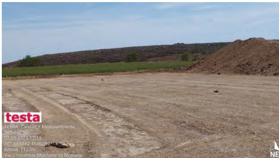
Jalonamiento con piedras pintadas.