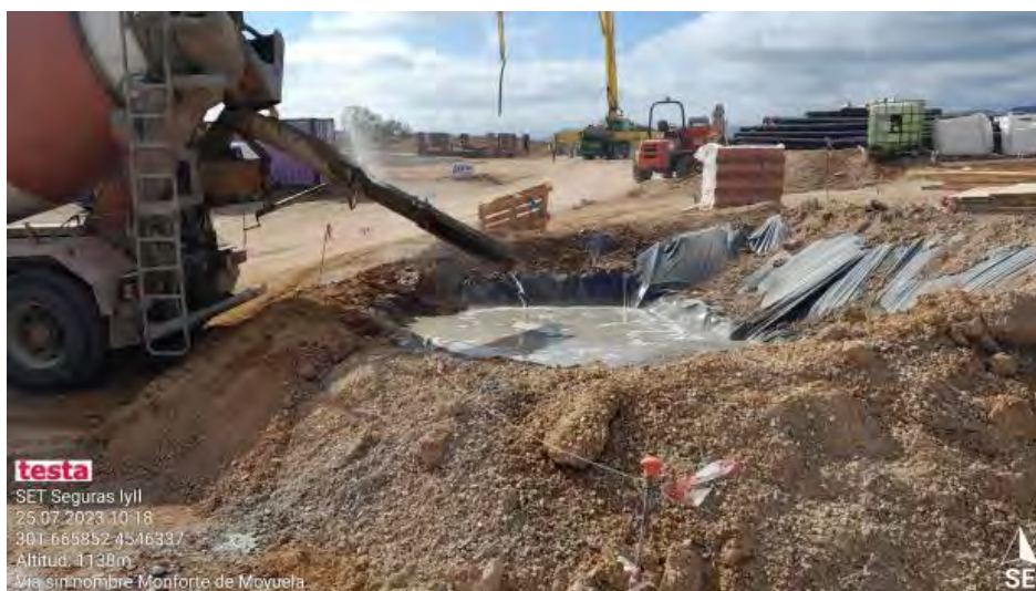
Lavado de cubas en SET Seguras.