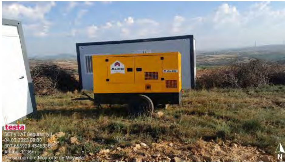
Generador sin la debida protección del suelo.