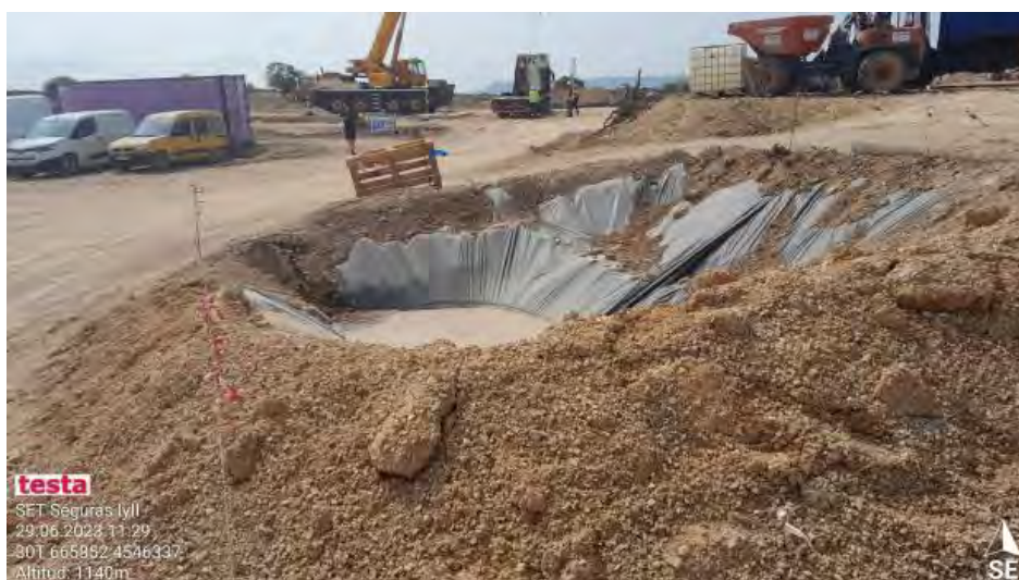
Pozo de lavado inadecuado