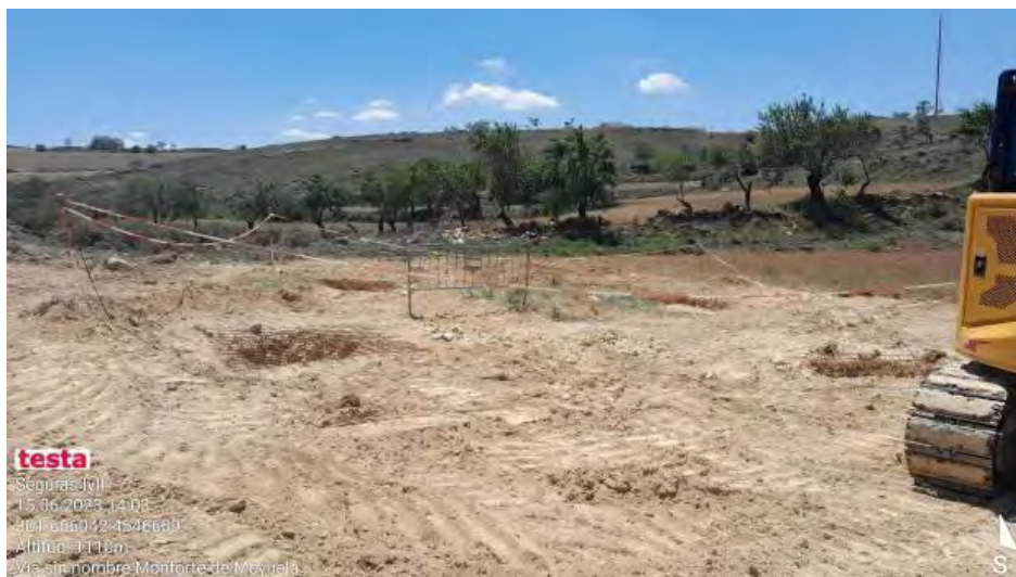
Preparación de los primeros apoyos de LAT ( A-2)