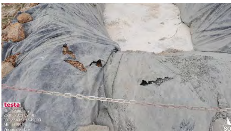
Pozo de lavado incorrecto en SET Monforte.