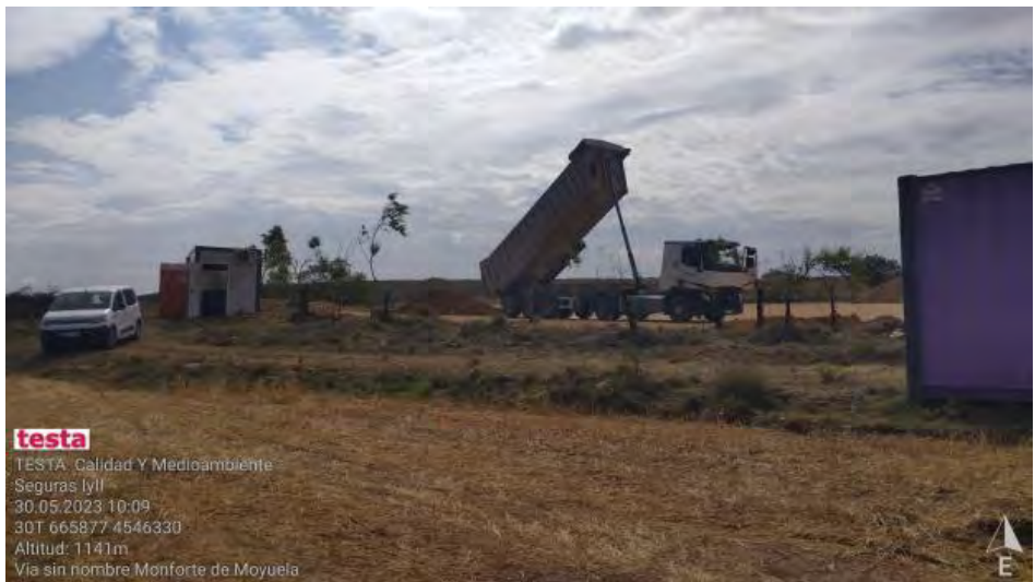
Extendidos de zahorra en SET