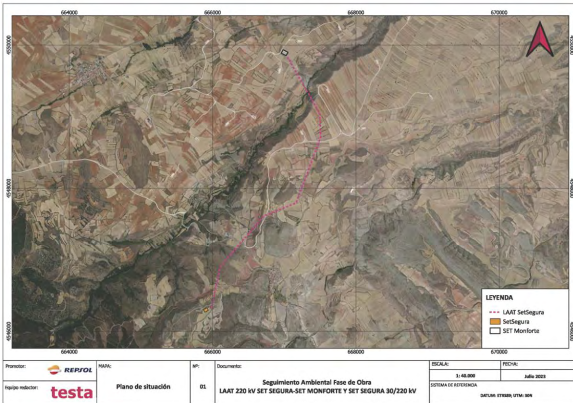
Imagen 1. Mapa de situación de la LAAT Set Segura-Set Monforte.

La línea aérea de alta tensión 220 kV “SET Segura - SET Monforte” y la SET Segura 30/220 kV se encuentran en los términos municipales de Monforte de Moyuela y Loscos (Teruel).