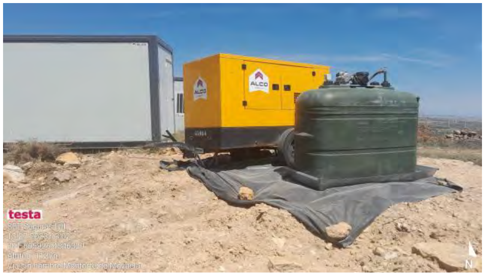
Generador y depósito con protección de suelo .