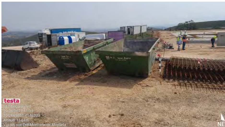
Contenedores de RNP en SET.