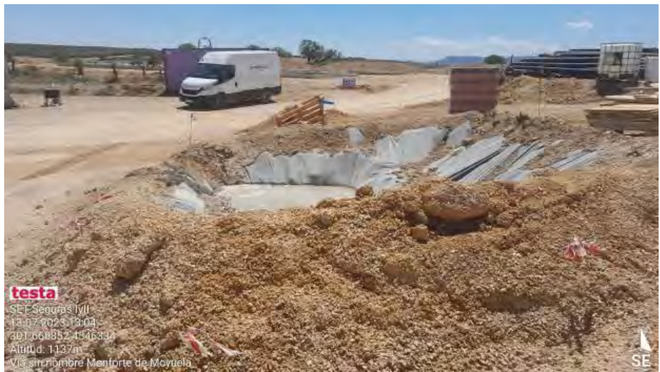
Pozo de lavado inadecuado