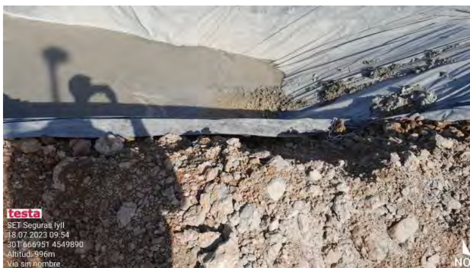
Pozo de lavado correcto en SET Monforte.