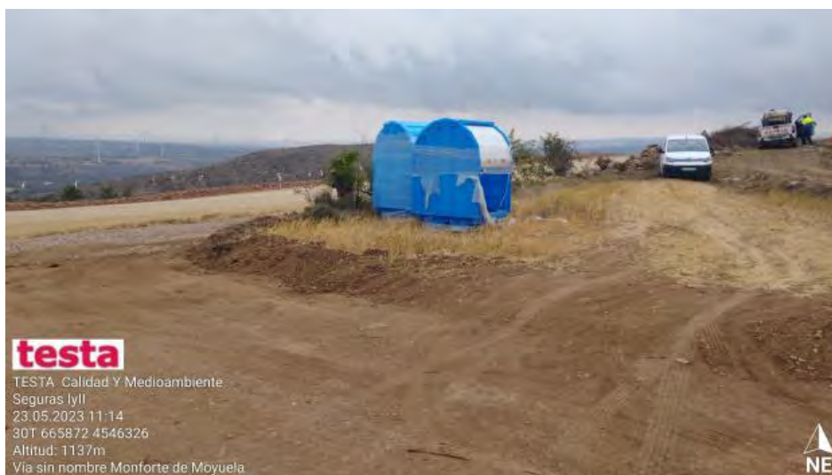
Preparación de contenedores para próxima ubicación en SET