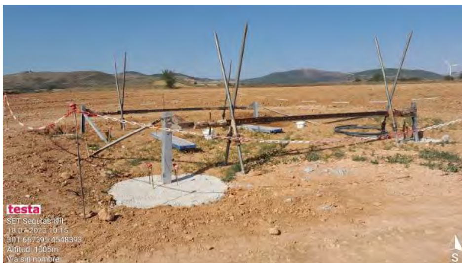
Hormigonado de cimentación de apoyo , correcto.