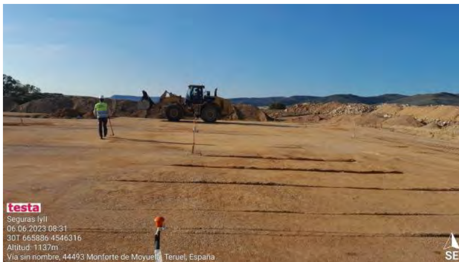
Extendidos de zahorras