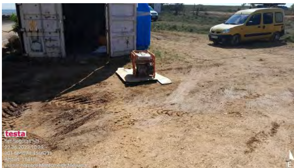
Generador con protección deficiente.