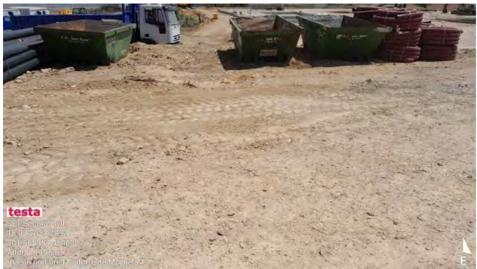
Limpieza de derrame en punto limpio.