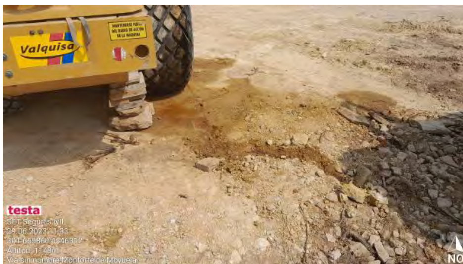
Derrame por avería en máquina.