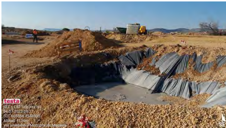
Pozo de lavado inadecuado