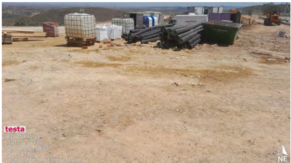
Manchas de residuos frente a contenedores RNP.