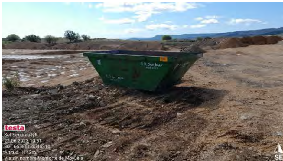
Contenedor de RNP en SET.