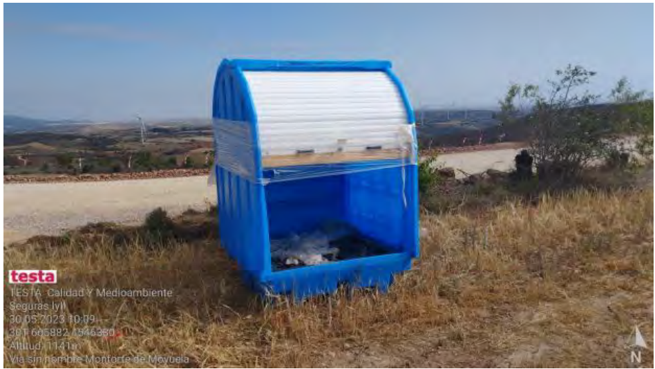
Preparación de contenedores RP para próxima ubicación en SET