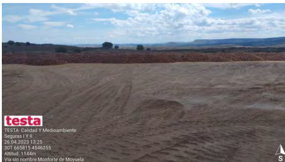
Separación de tierras