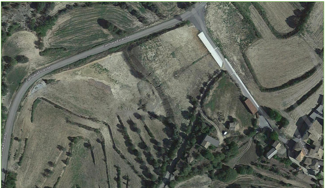
Imagen de la zona objeto de reclasificación. Se observa el proceso de urbanización de la parcela ya iniciado con diferentes infraestructuras. La zona ha pasado de ser campos de cultivo de cereal a una superficie aplanada y con taludes perfilados ya acondicionada para su transformación urbana.

Se señala que en las parcelas referidas durante el año 2021 se llevaron a cabo la instalación de los servicios de abastecimiento y de saneamiento y la preinstalación de electricidad necesarios para el uso previsto. También se procedió a la pavimentación de la calle proveniente del núcleo urbano, conectándose con la carretera situada al norte, y a la pavimentación de una zona anexa dedicada a aparcamiento.