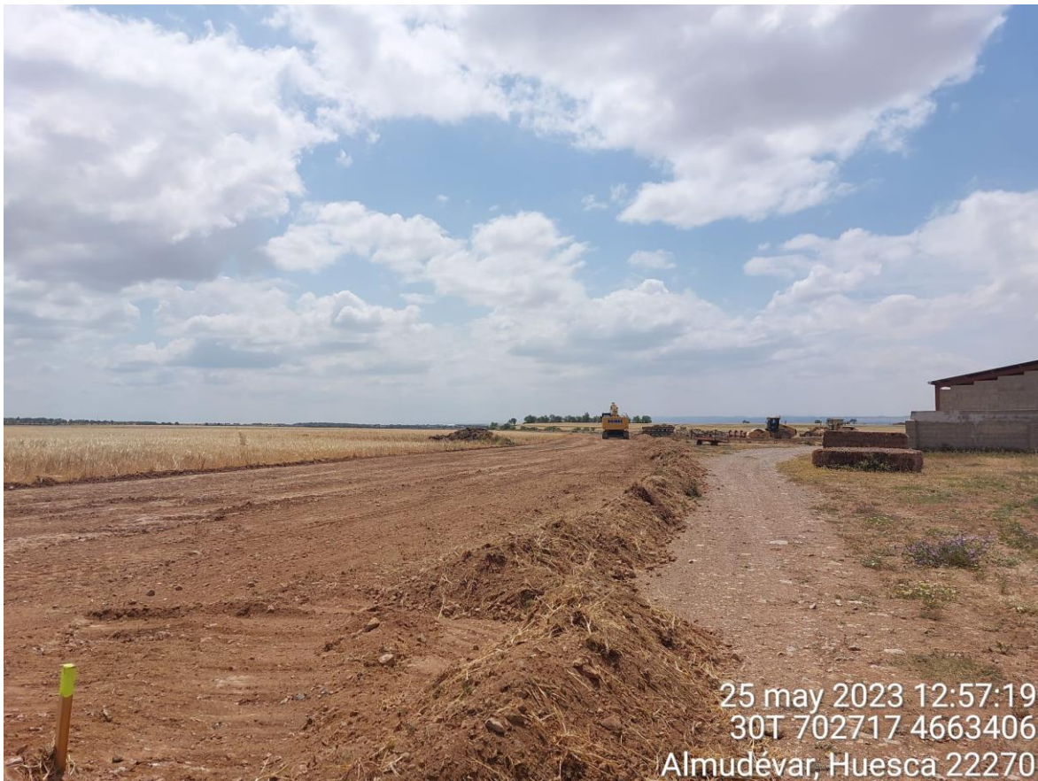
Imagen 1. Cordón de tierra vegetal acopiado correctamente