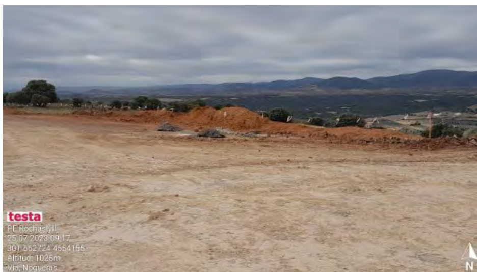
Restos de sobrante para limpiar y gestionar