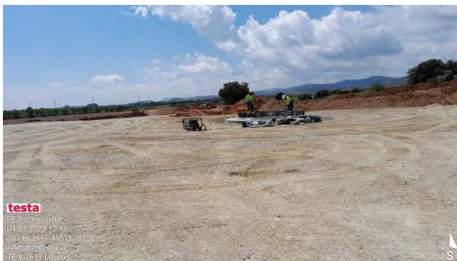
Trabajos de revestimiento en RH2-1