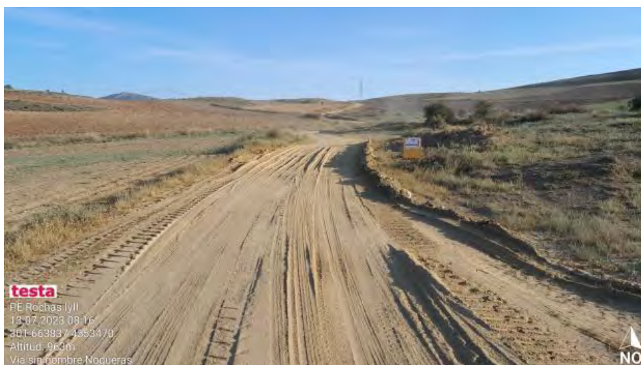
Acumulaciones de polvo en tramos concretos de los viales.