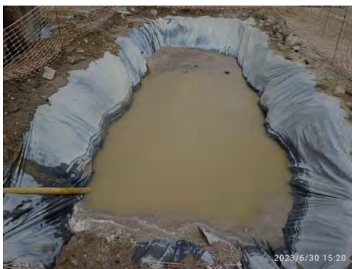
Pozo de lavado finalizado el hormigonado en RH2-2