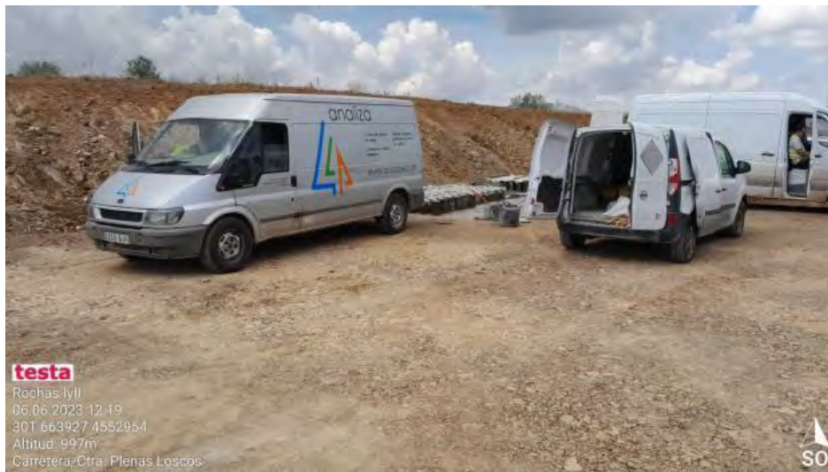
Aislamiento en pruebas y análisis de hormigón