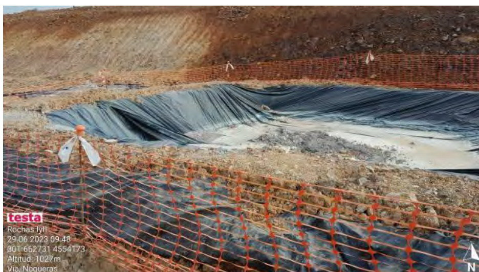
Nuevo pozo de lavado en correcto estado