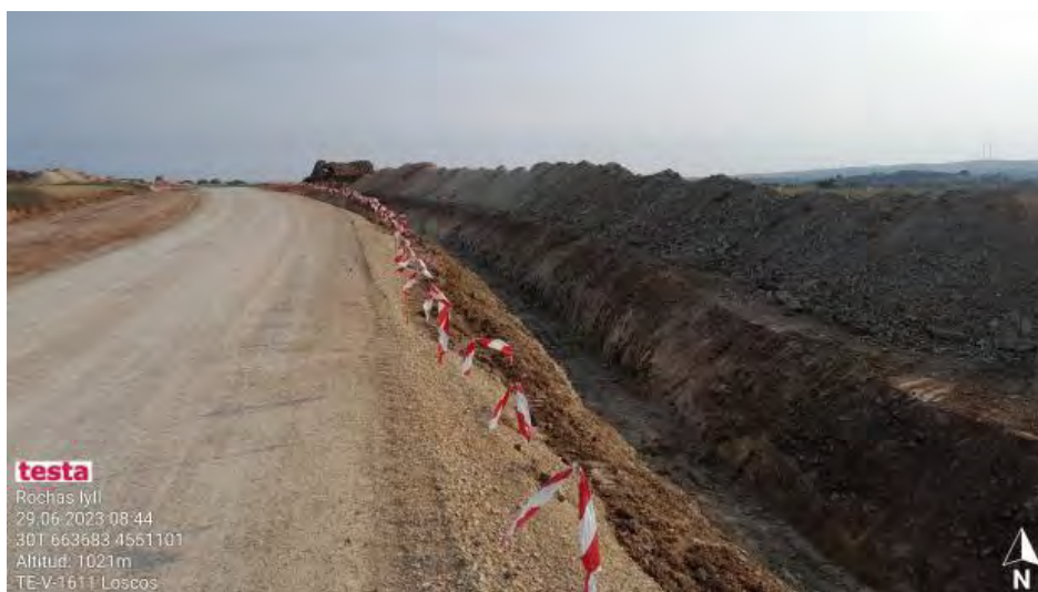
Separación de tierras en zanja de evacuación.