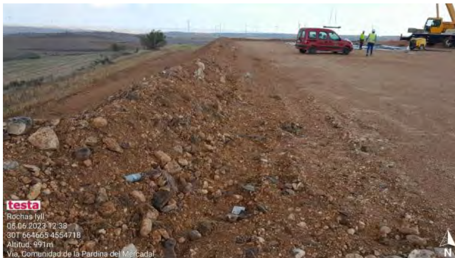
Nueva localización de falta de limpieza y basura en RH2-6