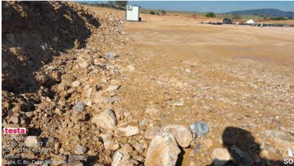
Residuos en plataforma.