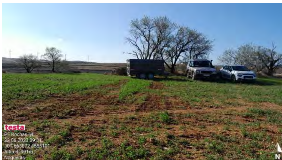
Vehículo de repostaje sin la adecuada protección de suelo . Se indica que se subsane .