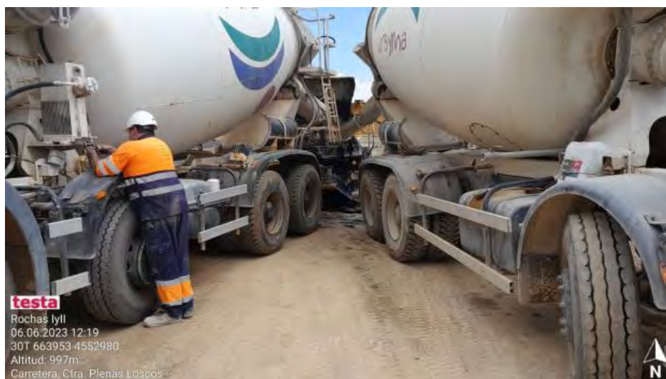
Aislamiento de suelo en bombeo de hormigón