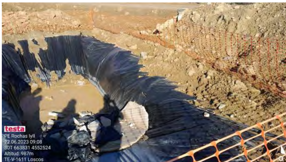
Pozo con defectos. Se indica que se repare.