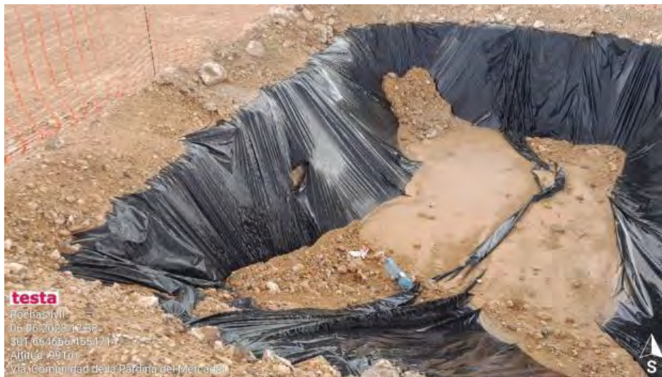
Pozo a la espera de reparar .