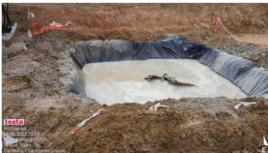
Pozo de lavado RH2-3 reparado