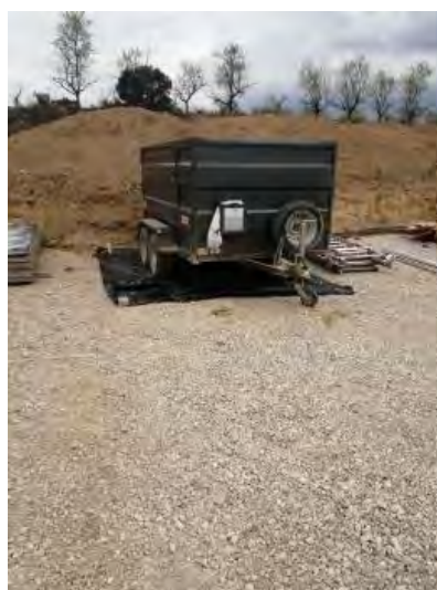
Dispositivo de repostaje aislado