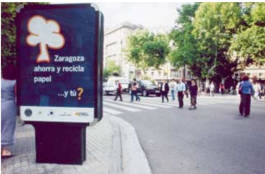
Difusión mediante elementos publicitarios.