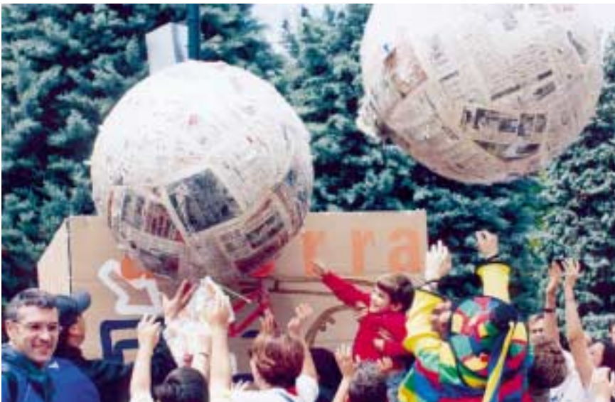
Un momento de la Fiesta del Papel.