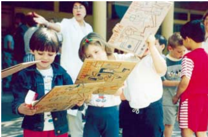
Distribución de papeleras.