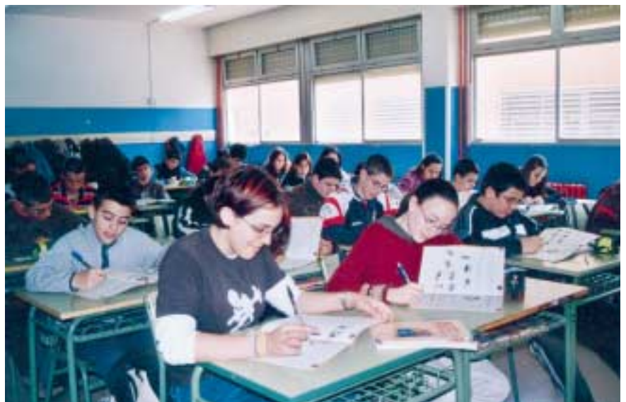
Empleo de materiales didácticos en el aula.