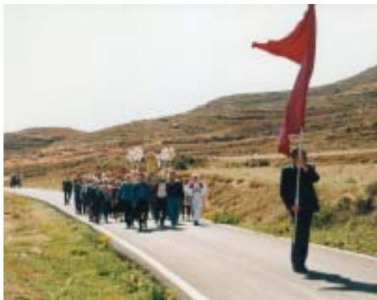
Grisel. Los romeros de Samangos acuden a las cortesías

Las romerías son peregrinaciones a ermitas o lugares santos que se repiten periódicamente cada año. Tienen un carácter festivo, de forma que los actos religiosos se acompañan de música, entretenimientos y comidas de confraternización. La costumbre de acudir a estos lugares permanece muy arraigada en los comportamientos colectivos de la población. En el transcurso de la historia, diversas religiones y culturas han incorporado estos lugares a sus respectivas tradiciones. Con el buen tiempo comienzan a aparecer en nuestro territorio esas citas, que jalonan el calendario prácticamente desde abril a septiembre.