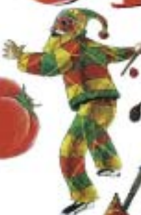
Cipotegado de Tarazona moderno y antiguo