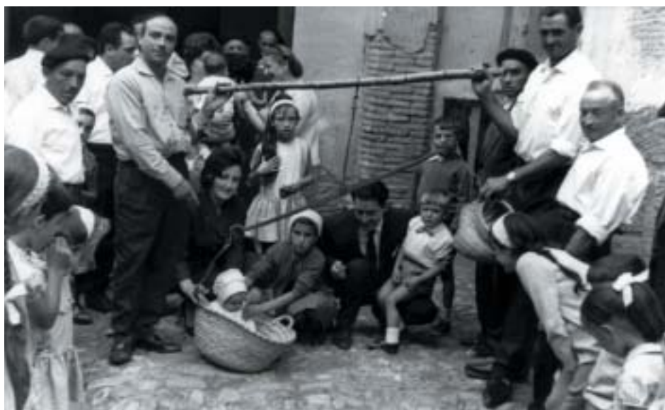
Lituénigo. Pesaje de los niños

En los orígenes de esta fiesta se mezclan historia y leyenda. Cuentan que un matrimonio que no podía tener descendencia pidió consejo a un fraile capuchino, quien les aseguró que debían encomendarse a San Miguel y ofrecerle, como limosna, el peso en trigo de la criatura recién nacida. El hijo llegó y los padres cumplieron su promesa.