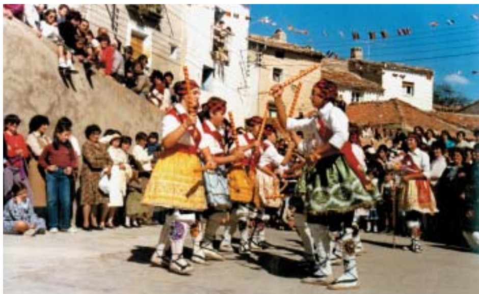
Añón de Moncayo. Paloteau de El Buste

Añón de Moncayo, El Buste, Grisel, Litago, Malón, Novallas, San Martín de la Virgen del Moncayo, Tarazona y Vera de Moncayo.