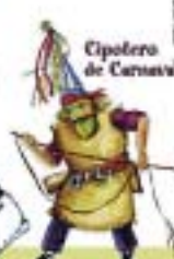
Cipotero de Carrión