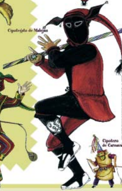
Cipotegado de Maleján