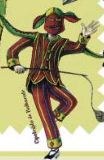
Cipotegado de Valdebarate