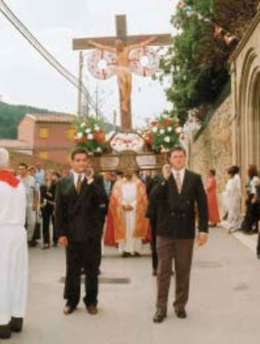
San Martín de la Virgen del Moncayo. Procesión del Santo Cristo

También tenemos noticia de otros festejos vinculados al disfraz, a la inversión de papeles, como los obispillos , el rey de gallos y los Santos Inocentes. En la misma línea, aunque con un sentido religioso, los niños se vestían con ropajes diversos el día de la Santa Infancia, recordando así las diversas naciones del mundo en que misionaba la Iglesia Católica.