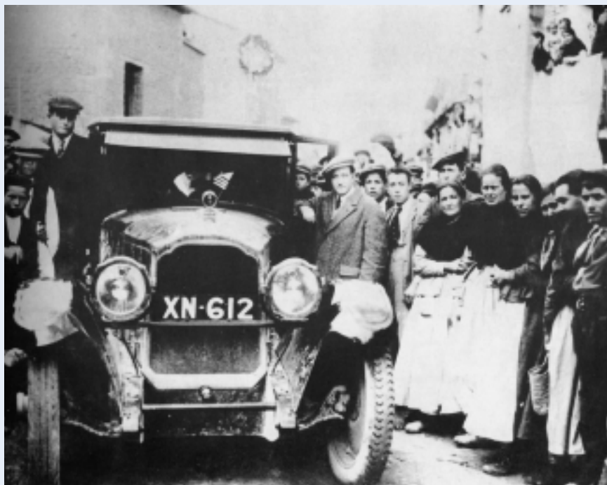
Miguel Fleta visitando su pueblo natal

Sin embargo, al final de su vida pasa muchas dificultades, especialmente problemas económicos ya que tiene que pagar una fuerte suma al Metropolitan por incumplimiento de contrato. Entre 1932 y 1933 realiza giras de zarzuelas por diferentes ciudades españolas: en Barcelona, por ejemplo, canta Carmen y Doña Francisquita , y, además, durante 1933 rueda la película Miguelón . A ello siguen nuevas actuaciones en Europa (Cannes, donde cantó Carmen , Amberes, Bruselas, Munich) y El Cairo, y en 1935 retoma la zarzuela con la compañía del maestro Moreno. Al año siguiente es nombrado profesor numerario de la cátedra de canto del conservatorio de Madrid.