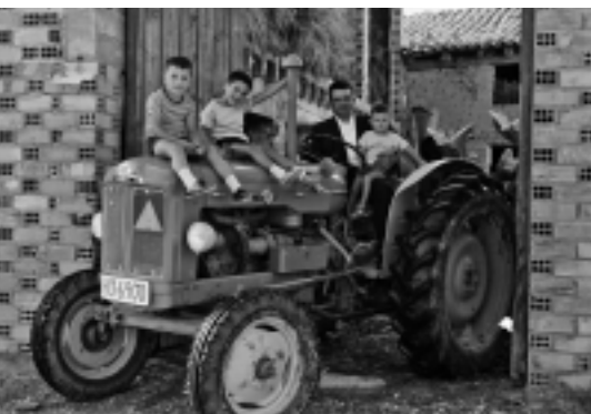
Cofita (Fonz). Tractor Ebro. Fotografía tomada por Santiago Fumaz en los años 60

los años cincuenta del siglo XX comenzó a utilizar cámaras con negativos de 35 mm. La fototeca de la Diputación Provincial de Huesca conserva una magnífica colección formada por más de 15.000 de sus fotografías.