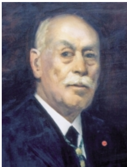
Mariano de Pano y Ruata en 1931

Nació en 1847 en el seno de una familia infanzona de Monzón. Desde muy joven ocupa cargos políticos y académicos: en 1874 es nombrado vocal de la Diputación Provincial de Huesca y catedrático de Historia Universal en el Establecimiento Literario Privado de Cerbuna en la villa de Fonz durante el curso 1874-1875. En mayo de 1879 es elegido concejal del Ayuntamiento de Monzón y accede a la alcaldía. Durante su mandato como alcalde de Monzón se dictan las primeras ordenanzas municipales y se inaugura el nuevo abastecimiento de aguas. Asiste además en Sigüenza al reconocimiento de los sepulcros de los reyes Alfonso II y Sancha y de las infantas Dulce y Leonor. Posteriormente es nombrado diputado provincial.