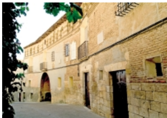
Fonz. Casa natal de Pedro Cerbuna, conocida también como Casa Moner

Pedro Cerbuna nació en Fonz en 1538. Estudió en las universidades de Valencia, Alcalá y Lérida y se doctoró en Teología. Fue canónigo de la sede metropolitana de Zaragoza y vicario general. A él se debe la fundación de la Universidad de Zaragoza, creada oficialmente en 1542 –aunque sus Estudios Superiores eran anteriores– a raíz de la petición hecha por la ciu-