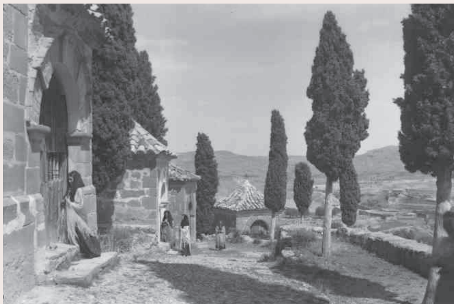
Subida al Calvario

El Calvario de Alloza es un espacio para caminar en silencio bajo la sombra protectora de los cipreses, respirando el aire que atraviesa sus enormes ramas. A veces se perciben antiguos aromas o se escucha el sonido de la campana que llamaba a la oración y que en tiempos pasados orientaba a los caminantes al atardecer.