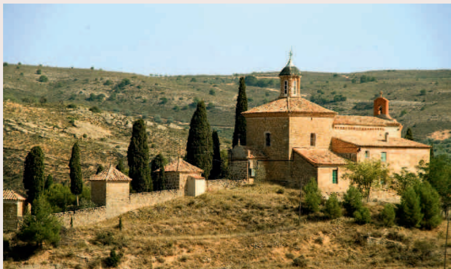
Alloza. Vista general del Calvario

El templo que alberga el Santo Sepulcro data de 1713. Es de sillería y ladrillo, con una nave de dos tramos cubierta con bóveda de medio cañón y una cúpula en la cabecera, adornadas ambas con bellas pinturas de autor desconocido. Los azulejos de las paredes y del pavimento son de 1788, y también son