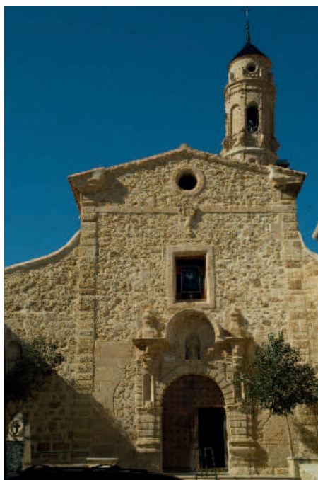
Ariño. Iglesia parroquial del Salvador

Ariño luce orgullosa una de las torres-campanario más originales de toda la provincia de Teruel, restaurada recientemente. La iglesia parroquial del Salvador, templo barroco del siglo XVIII,