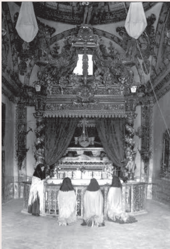
Imagen antigua del interior del Calvario

diversas familias del pueblo. La tumba de un ermitaño enterrado en 1738 permanece en un rincón semioculto del suelo y en la fachada del edificio se pueden leer antiguas inscripciones grabadas en la piedra por algunos de los que cuidaron del Calvario.