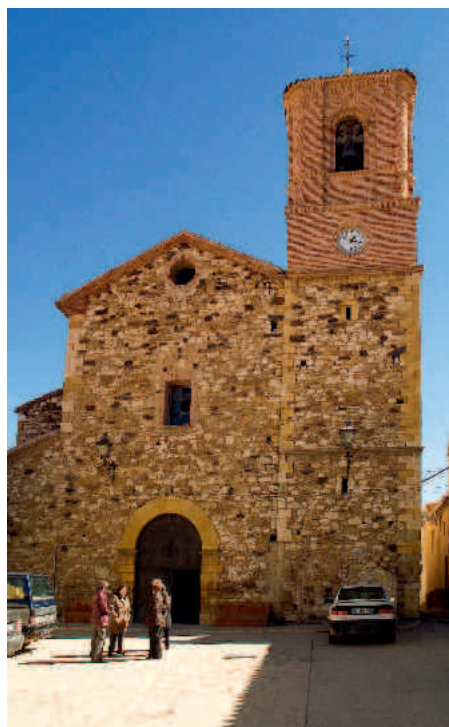
Estercuel. Iglesia parroquial de Santo Toribio

La ermita de Santo Toribio es una fábrica barroca más sencilla, también realizada en mampostería. La ermita del Olivar, sin embargo, es de sillería y ladrillo. La capilla de los Santos Mártires, hito en el recorrido de la Santa Encamisada de Estercuel, es otro arco de acceso a la población que en su parte posterior presenta una pequeña capilla, en este caso bajo la advocación de San Fabián, San Sebastián y San Antón, santos