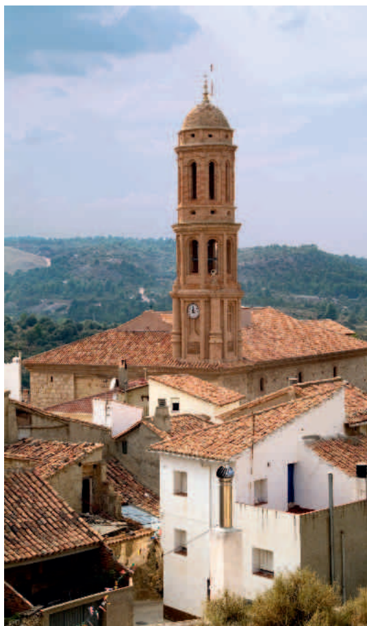
Crivillén. Torre-campanario de la iglesia parroquial

A pesar de que Crivillén es uno de los municipios más pequeños de la comarca, la calidad de su patrimonio cultural lo convierte en uno de los más interesantes de la contornada . De hecho, la torre de su iglesia parroquial fue declarada Monumento Nacional en 1982 en atención a las pervivencias mudéjares que muestra, aun cuando está datada en el siglo XVIII, y que la hacen única. La iglesia parroquial de San Martín de Tours consta de tres naves, que se cubren con bóveda de medio cañón con lunetos las laterales y la central con tres cúpulas vaídas –la del medio con linterna– sobre pechinas, decoradas con estucos que representan a los Evangelistas en la primera cúpula; a San Antonio, San Egidio, San Martín y San Blas en la cúpula central; y a San Gregorio, San Jerónimo, Santo Tomás de Aquino y San Ambrosio en la tercera. En las cúpulas primera y tercera hay frescos dedicados respectivamente a la Asunción de la Virgen y la Ascensión del Señor.