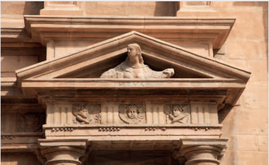
Eva. Detalle de la portada de la parroquia andorrana

Pero para comprender tan magna obra, debemos remitirnos a la época de su nacimiento entre 1597 y 1609. En aquellas fechas, en el tránsito del siglo XVI al siglo XVII, Aragón se veía sometido a diversas alteraciones y revueltas en unos y otros lugares de su territorio. No obstante, a esta inestabilidad política le acompañó un intenso movimiento comercial y cultural, del que se beneficiaron estas tierras de Andorra pues eran lugar de tránsito continuo de los viajeros que recorrían el interior peninsular en su camino hacia la costa.