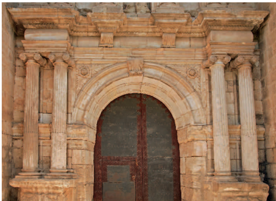
Ejulve. Detalle de la portada renacentista de la iglesia parroquial

Pero Ejulve guarda todavía más sorpresas para el aficionado a la arquitectura. Por ejemplo, la ermita de San Pedro, una sencilla construcción de mampostería, probablemente del siglo XVI, de una sola nave de tres tramos, con techumbre de madera sobre dos arcos diafragma apuntados. O, también, la ermita de San Pascual Bailón, una notable edificación barroca datada en 1688, de tres naves, con la central cubierta con bóveda de cañón con lunetos y cúpula sobre pechinas, decoradas estas con relieves en estuco de los evangelistas, motivos de la heráldica local y otros símbolos marianos y bíblicos. En el exterior, presenta una portada de un solo cuerpo consistente en un arco de medio punto sobre columnas adosadas y coronado por un frontón curvo, que muestra cierto impulso decorativo, adornándose con volutas y pirámides de bolas. Por último, la ermita de Santa Ana, que además de ofrecer unas magníficas vistas del municipio y su entorno, es una sencilla edificación de mampostería, de una nave dividida en cuatro tramos mediante arcos apuntados de sillería, de origen tardomedieval, aunque con reformas hasta el siglo XVII.