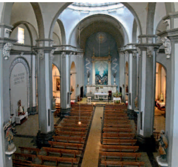
Oliete. Interior de la parroquial barroca

La torre-campanario se sitúa a los pies, en el ángulo noroccidental. Es de ladrillo, de seis cuerpos, y está decorada con elementos de tradición mudéjar a pesar de su tardía cronología, hecho que se