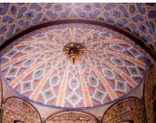
Iglesia parroquial de Andorra. Aspecto actual de las bóvedas decoradas con yaserías barrocas

La ermita de Santa Bárbara, que no podía faltar en una localidad eminentemente minera, es un sencillo templo de los siglos XVIII-XIX, de una sola nave cubierta con bóveda de medio cañón con lunetos.