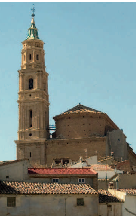
Alloza. Iglesia parroquial

Alloza ofrece uno de los conjuntos religiosos más interesantes de la comarca desde el punto de vista histórico-artístico. Su iglesia parroquial, con su magnífica torre, su calvario monumental así como pequeñas ermitas distribuidas en todo el municipio nos hablan de un pasado notable que hoy se está recuperando.