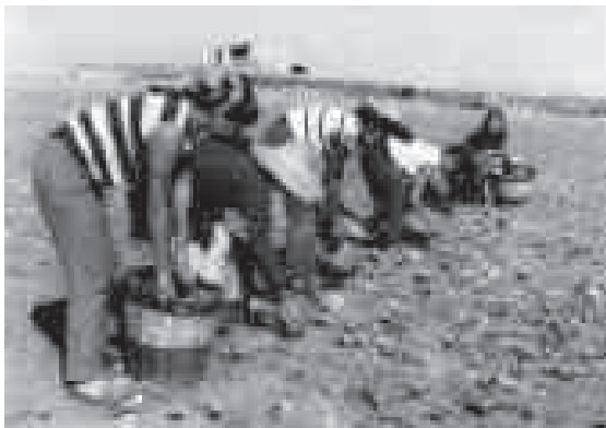
El cultivo del azafrán es solo recuerdo en la comarca (Año 1970. Recogiendo la flor del azafrán en Lécera)

Bodegas Tempore, de alabastro y ladrillo, en Lécera, conducidas por los hermanos Yago Aznar, presenta un diseño innovador. Destaca Tempore tempranillo roble , color rojo granate con tintes morados, madurado durante 6 meses en barricas nuevas de roble americano. Y Tempore viña centuria , color cereza granate, madurado durante 10 meses en barricas de roble francés.