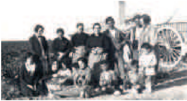
Descanso en la vendimia. Lécera, hacia 1920

otros vinos del Campo de Belchite no pertenezcan a ninguna Denominación de Origen, se consideren “Vinos de la Tierra” o zona geográfica delimitada que mantiene un estrecho vínculo entre el vino y el terreno (su “terroir”), dejándose abierta la posibilidad de conseguir la D.O. más adelante. A la zona “Campo de Belchite” pertenecen casi todos sus municipios y se suman otras localidades turolenses (como la afamada Muniesa) y algunas zaragozanas, dándose la circunstancia de que Bodegas Tempore de Lécera se ha vinculado a la zona “Bajo Aragón”. Su situación geográfica los encaja entre un clima continental y otro mediterráneo, de forma que las cepas se benefician del cierzo refrescante en el verano que palia las altas temperaturas diurnas y la falta de lluvias. Dos tronadas bastan para que el terreno almacene suficiente agua para todo el ciclo.