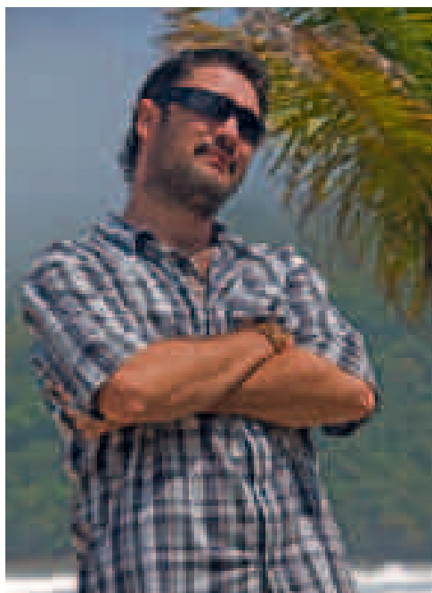
El rapero Javier Ibarra (Kase O)

Sí, pero no lo hice conscientemente, estaba escribiendo y me salió así, sobre todo porque antes escribía mucho en Azuara, ahora no tanto, ahora ya no voy tanto a escribir. He escrito casi la mitad de mis canciones allí, tenía como un locus amoenus escondidillo, me iba allí para concentrarme, relajarme y estar concentrado en la canción; me gustaba hacerlo al aire libre.