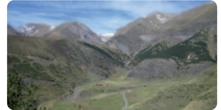
SECTEUR: VALLÉE DE BENASQUE - CHISTAU - BARRABÉS