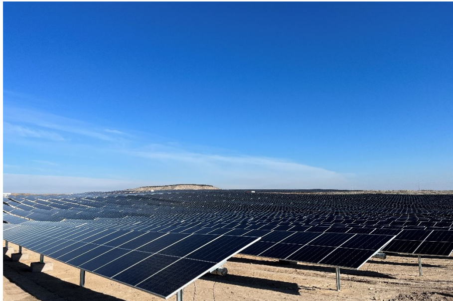
Figura 4 Valdompere 2

El presente anexo se compone de un número representativo de fotografías del total realizado durante el periodo evaluado, escogidas por su relevancia y/o carácter explicativo para la correcta comprensión del presente informe.