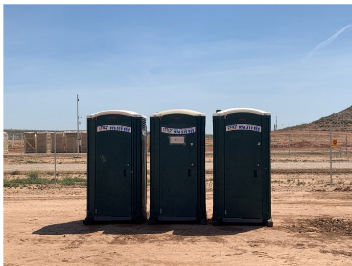
Figura 2 Baños químicos

La ejecución de los trabajos no afecta a cauces ni cursos de agua, tanto temporales como permanentes y la gestión de aguas residuales (baños químicos) se realiza correctamente.