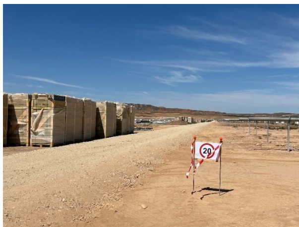
Figura 3 Señalización en obra

La obra dispone de cuba de agua y se realizan riegos con regularidad. Además, la obra cuenta con un límite de velocidad establecido de 20km/h para reducir de esta forma las emisiones de polvo.