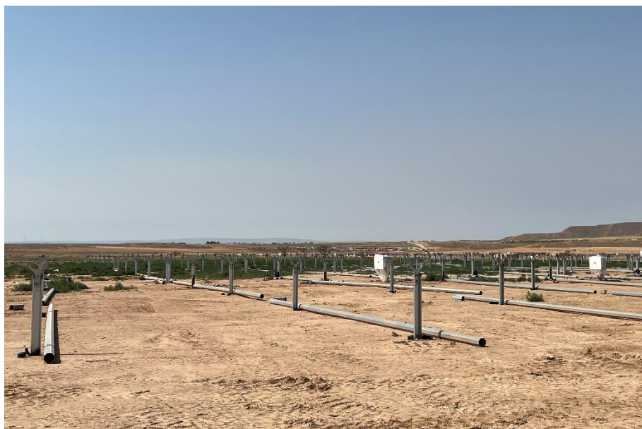
Figura 7 Montaje de los trackers

El presente anexo se compone de un número representativo de fotografías del total realizado durante el periodo evaluado, escogidas por su relevancia y/o carácter explicativo para la correcta comprensión del presente informe.