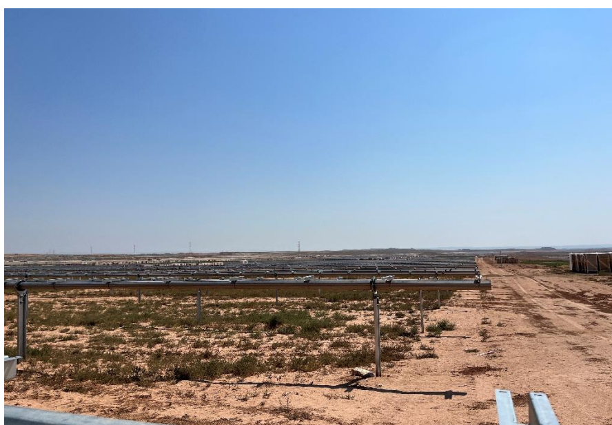
Figura 8 Montaje de los trackers