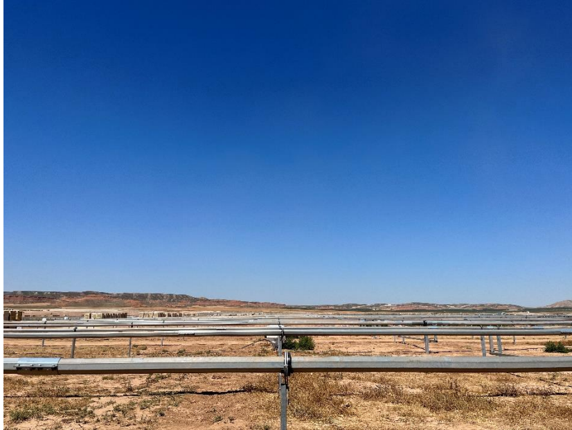
Figura 3 Montaje de los trackers

Durante este mes se ha finalizado el hincado, continúan con la colocación de los trackers, y se ha comenzado con el montaje de los módulos fotovoltaicos.