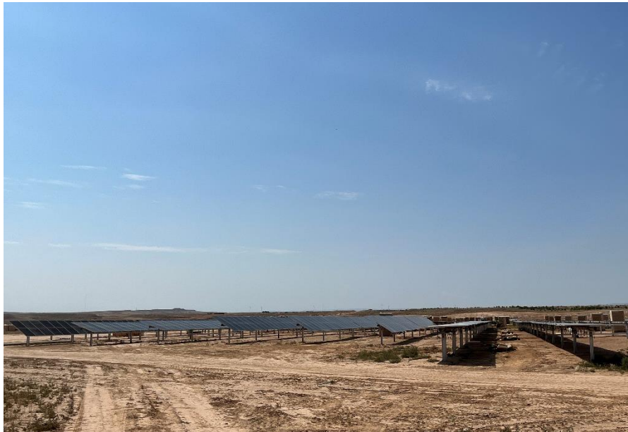
Figura 9 Montaje módulos fotovoltaicos