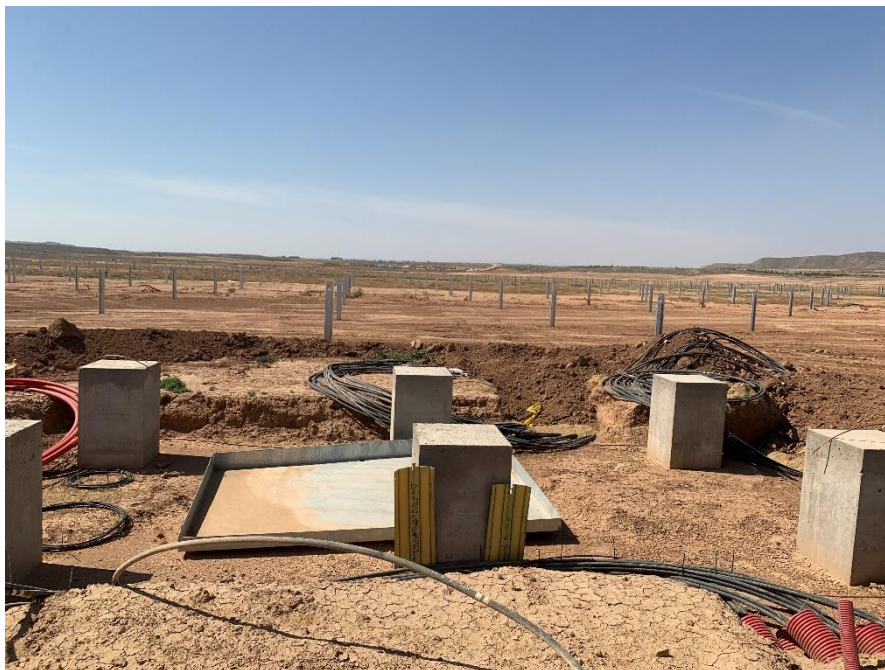
Figura 2 Cableado de los CT

Durante este mes, se ha continuado con el tendido de la red de media y baja tensión, con la conexión los inversores y los centros de transformación.