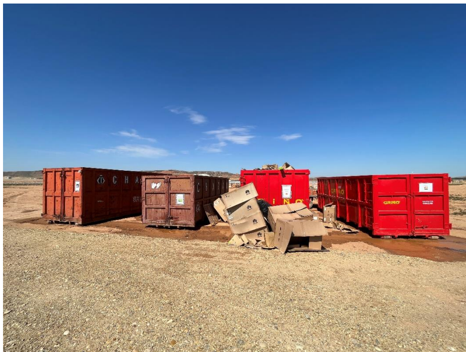
Figura 4 Punto limpio de RNP dispuesto dentro de la planta

Así como, el punto limpio de residuos peligrosos consta de seis bidones dispuestos dentro de un contenedor marítimo impermeabilizado. En cada uno se diferencian gases en recipientes a presión, plásticos contaminados, metales contaminados, material absorbente contaminado (bolsas de basura, trapos...), tierras contaminadas (tierras con sepiolita) y aceites de motor hidráulico.