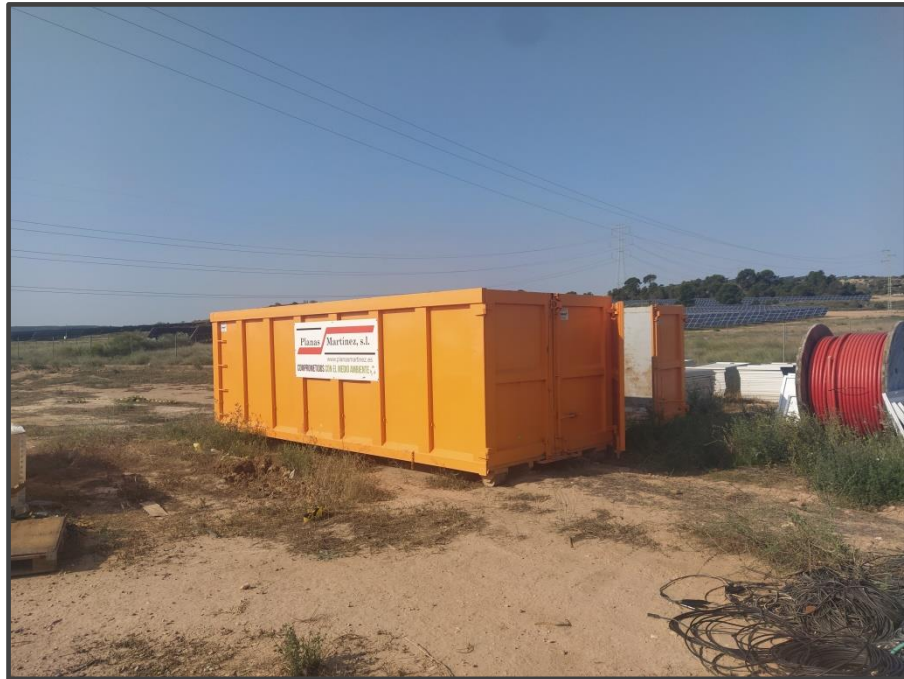
Fotografía 12. Contenedores de residuos.