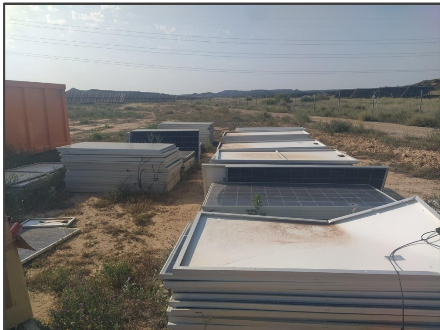
Fotografía 13. Zona de acopio de placas solares deterioradas.