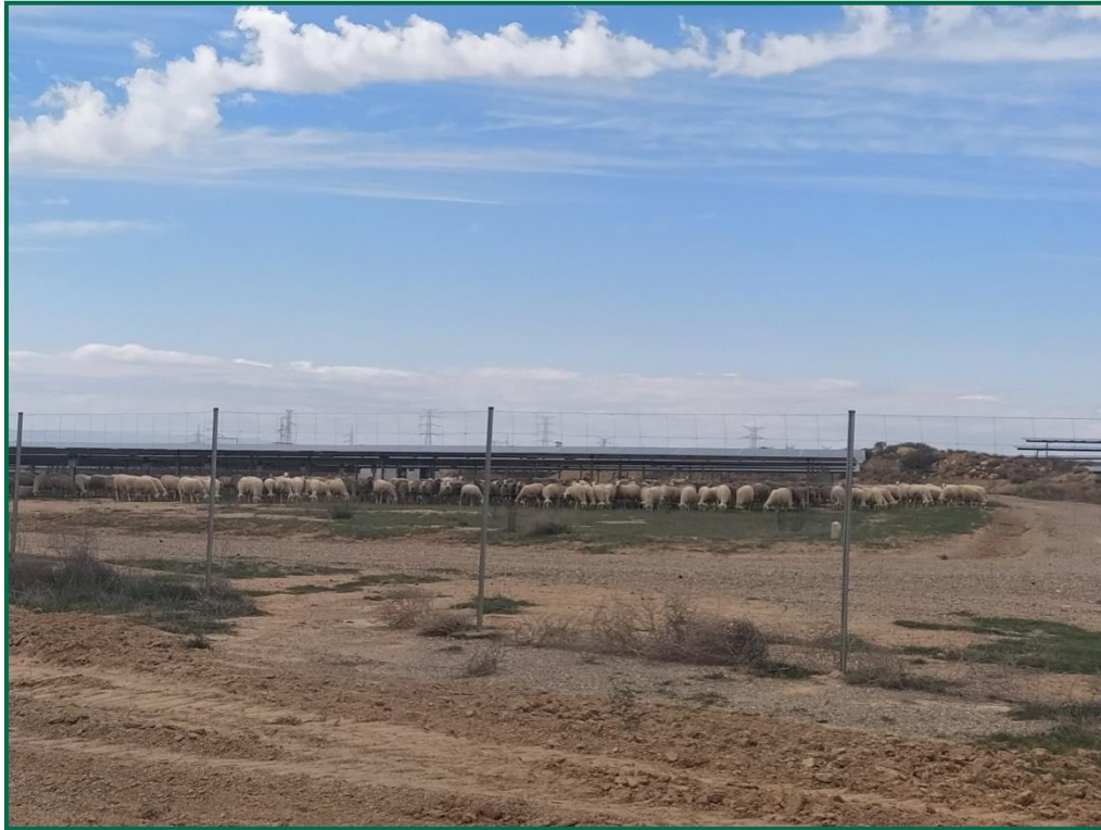
Fotografía 1. Ovejas pastando en el interior.