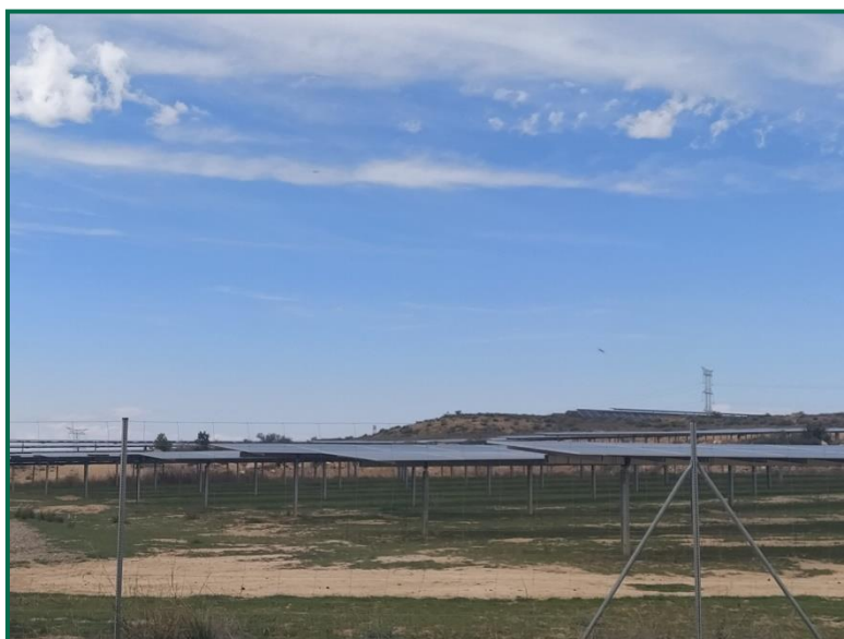
Fotografía 3. Vallado perimetral.

Respecto al vallado perimetral, se ha utilizado en todas las plantas malla cinéctica que permite el paso de fauna de pequeño tamaño. Este vallado mide 2 metros de altura total y está formado por una serie de alambres verticales y horizontales, con una separación entre los verticales de 30cm, y entre los horizontales de mínimo 15cm en la línea inferior. Este vallado no presenta elementos cortantes ni punzantes.