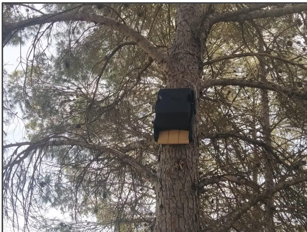
Fotografía 11. Caja para colonia de quirópteros.

La empresa que en la actualidad es propietaria y gestora de las Plantas fotovoltaicas está diseñando, adicionalmente a las medidas ya implantadas, y en colaboración con el área de Ecología de la Universidad de Zaragoza, un plan que desarrolle la forma más apropiada de implementar nuevas medidas, para lo cual se está realizando un estudio previo del medio, que incluye vegetación, suelos y fauna, y se redactará una propuesta de actuaciones, a consultar con la administración.