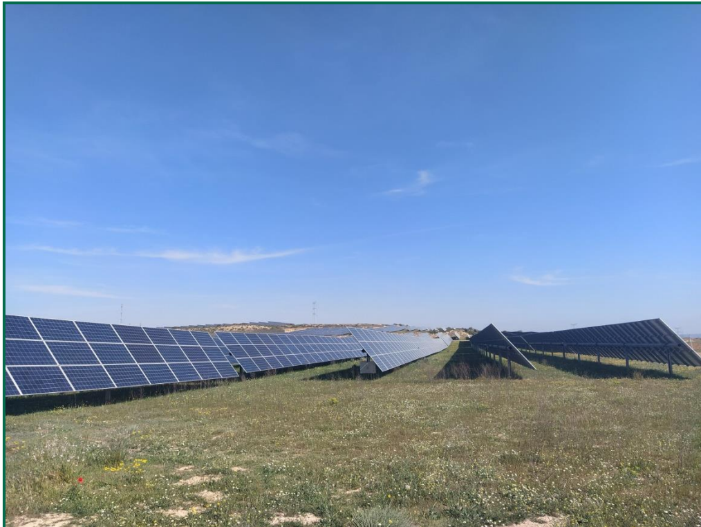
Fotografía 2. Vegetación entre placas actualmente.