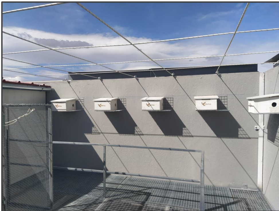
Fotografía 5. Interior del primillar, cajas nido.