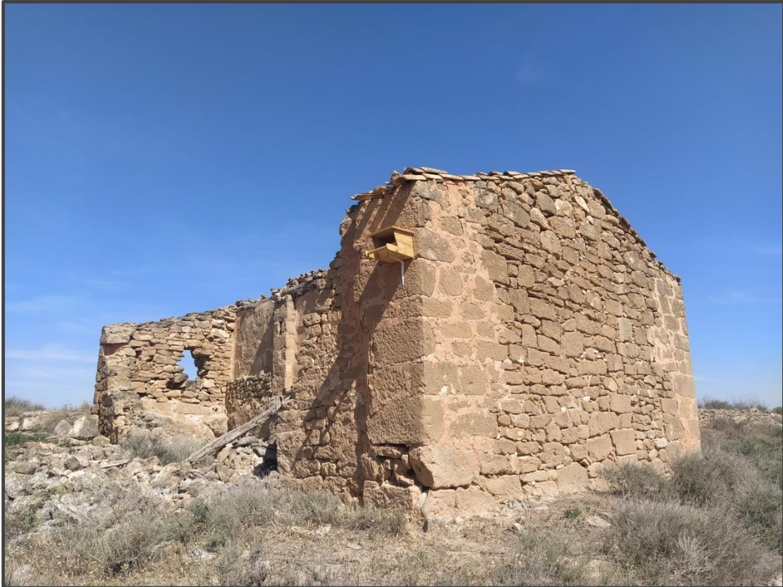
Fotografía 7. Caja para rapaz sobre construcción.