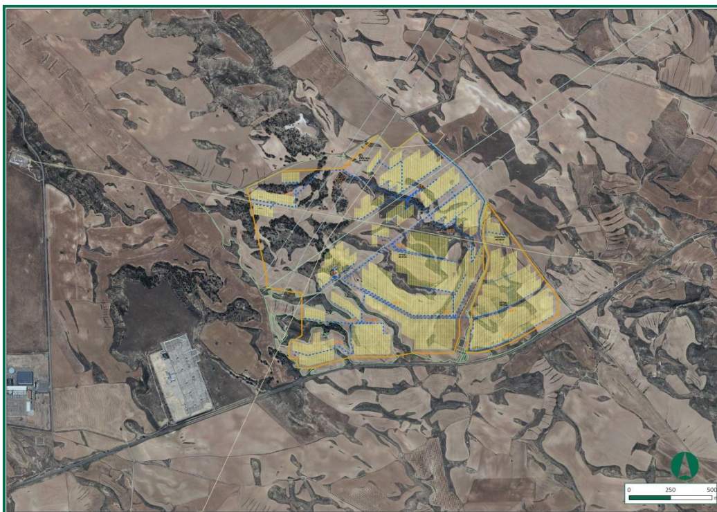
Figura 2. Localización de la zona de estudio.

La Planta FV proyectada por MEDIOMONTE SOLAR se extiende por un conjunto de parcelas, todas ellas pertenecientes al municipio de Escatrón, contiguas unas con otras y que suman una superficie total aproximada de 181,55 Ha, cuyo uso y calificación previa era agrícola.