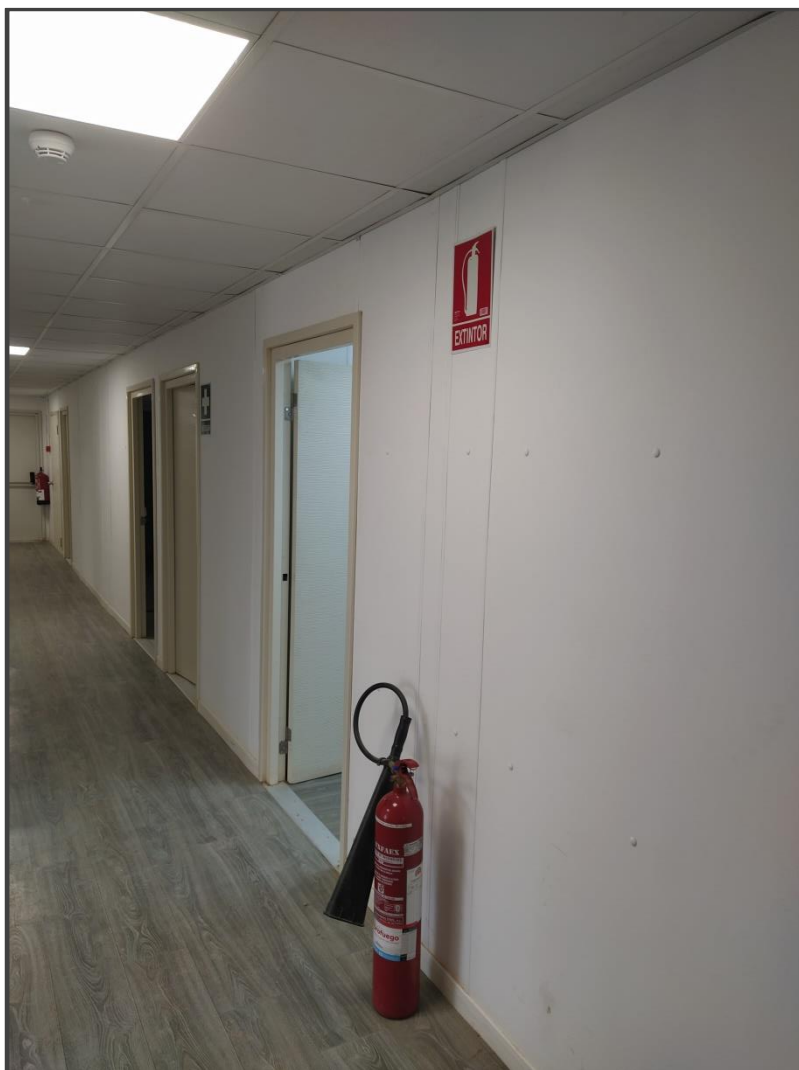
Fotografía 6. Extintores en edificio de control.