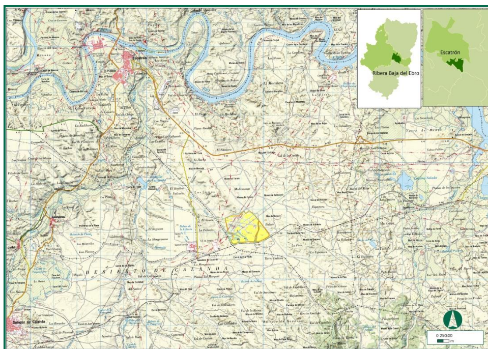
Figura 1. Ámbito de estudio.

La zona de implantación de la planta fotovoltaica “Mediomonte Solar”, se encuentra en el municipio de Escatrón, en la Comarca Ribera Baja del Ebro, en la provincia de Zaragoza. En concreto se sitúa en la hoja nº 441 “Híjar”, a escala 1:50.000 del Mapa Topográfico Nacional de España. La cuadrícula UTM 10x10 km en la que se incluye es la 30TYL26 y 30TYL36 .