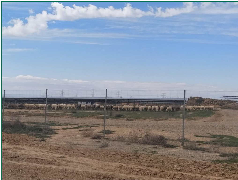
Fotografía 2. Vallado perimetral.

una serie de alambres verticales y horizontales, con una separación entre los verticales de 30cm, y entre los horizontales de mínimo 15cm en la línea inferior. Este vallado no presenta elementos cortantes ni punzantes.