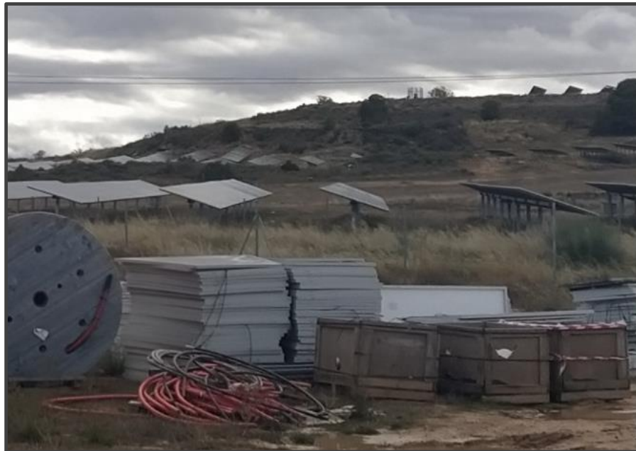
Fotografía 4. Zona de acopio de placas solares deterioradas.