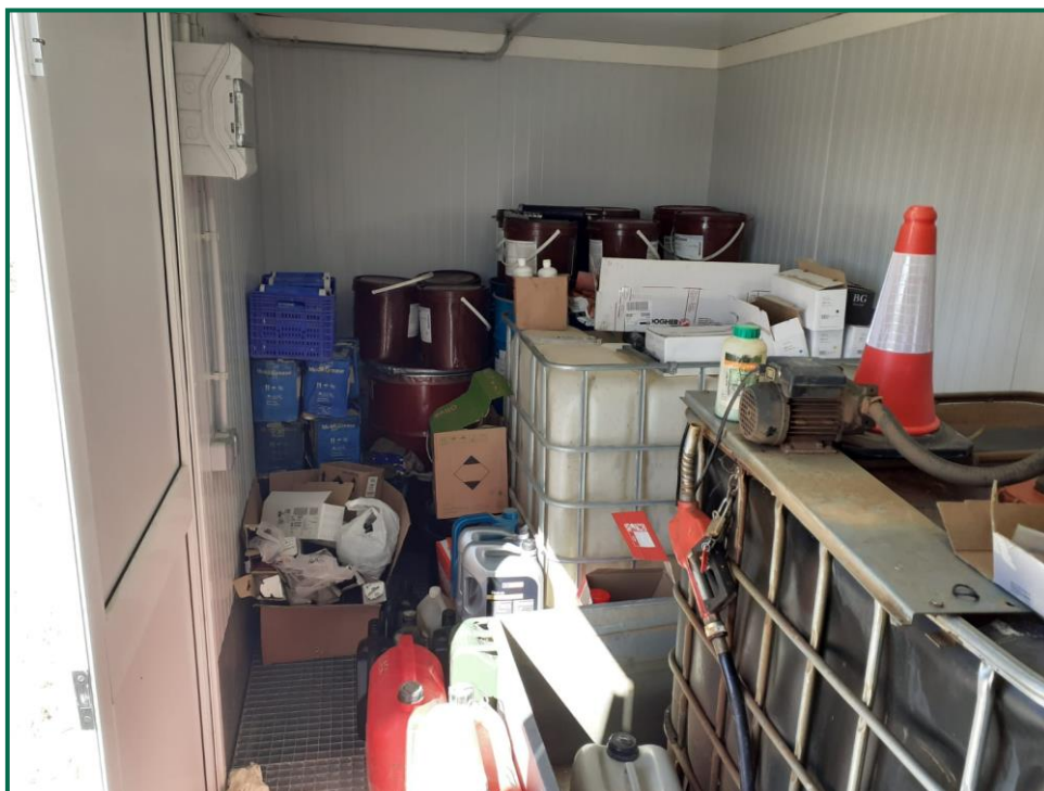
Fotografía 5. Bidones para residuos peligrosos.