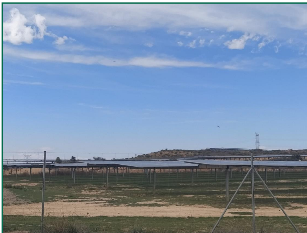
Fotografía 1. Vegetación entre placas actualmente.

Se ha realizado un seguimiento de la evolución de las revegetaciones realizadas durante los meses de invierno de 2020. Estas plantas se desarrollan, aunque se ha observado la desaparición de algunos ejemplares. Durante la primavera se produce un desarrollo de la vegetación espontánea de la zona, que en ocasiones compite con la vegetación plantada. En todo caso esta proliferación vegetal contribuye a evitar la erosión.