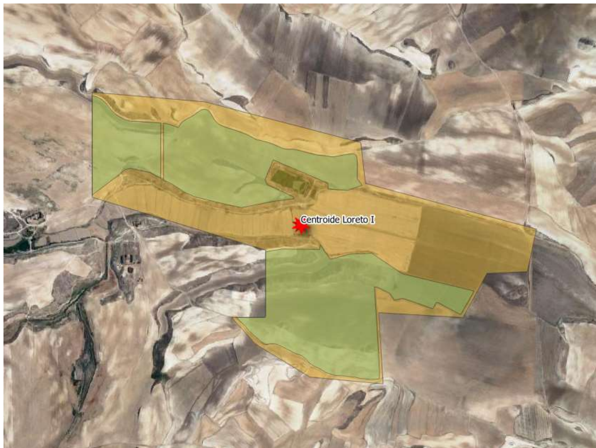
Ilustración 2: Centroides PFV Loreto I